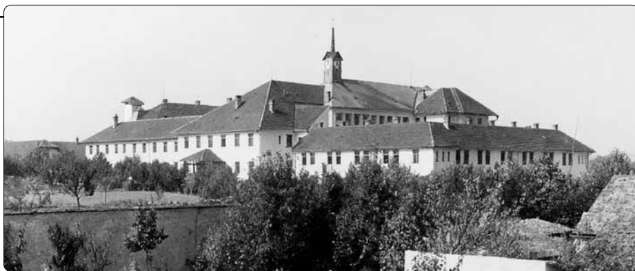
Kláster v Rajhradě před válkou