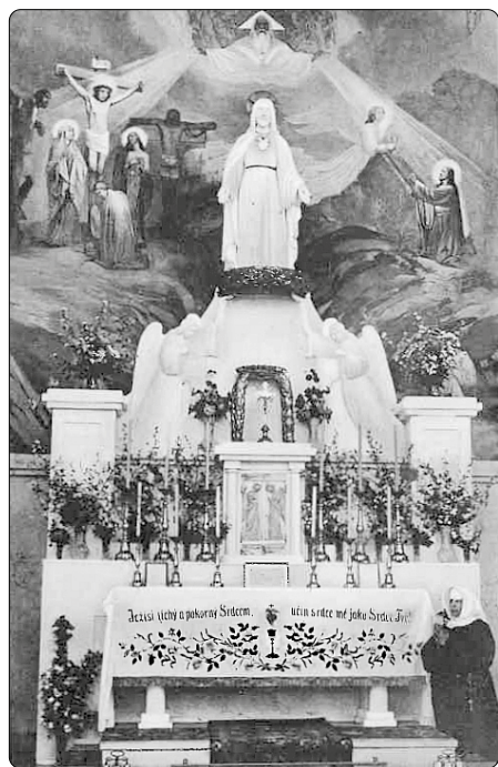
Hlavní oltář kláštera sester těšitelek v Rajhradě

Přecházející fronta v dubnu 1945 tvrdě zasáhla klášter v Rajhradě. Rudá armáda v přesvědčení, že v klášteře sídlí německé vojsko, objekt devět dnů bombardova-