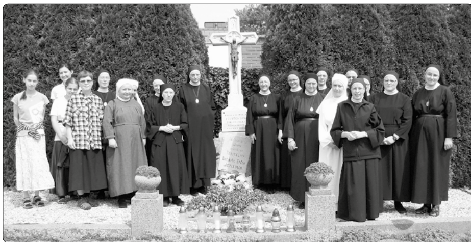
Sestry u hrobu Matky Rosy