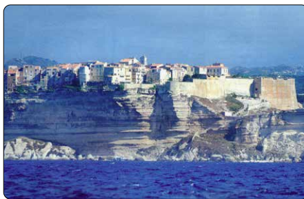
V přístavu Bonifacio napsal Newman báseň The Pillar of the Cloud

Období mezi léty 1864–1874 bylo pro Newmana co do publikování v oblasti teologie tím neplodnějším. Jeho četné