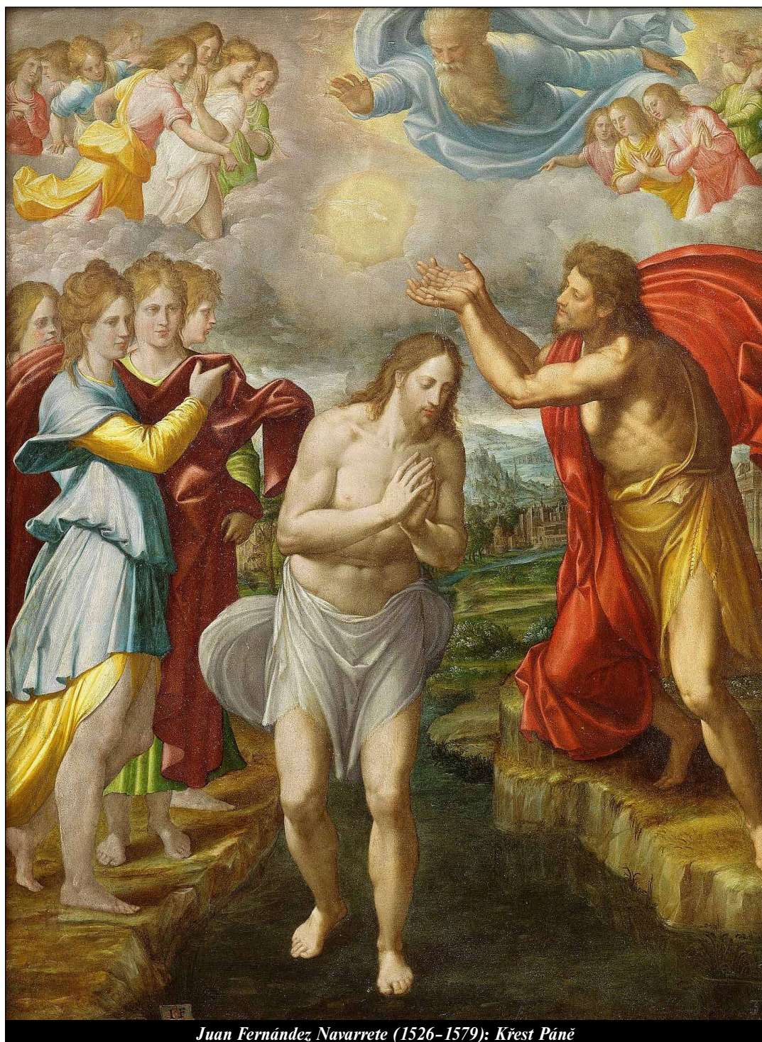
Juan Fernández Navarrete (1526-1579): Křest Páně

Cena Augustina Bey pro rok 2025 byla udělena kardinálu Dominiku Dukovi - strana 13 -