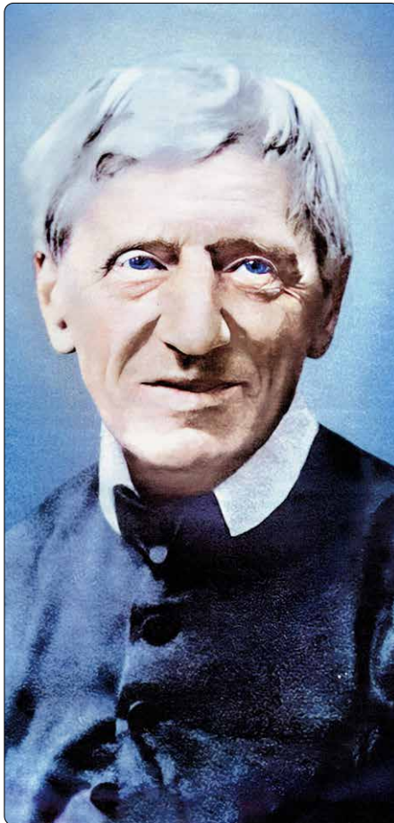
Kanonizační portrét J. H. Newmana

tělesní a nevěřící, jsou přesvědčeni, že pokušení, jež zakoušejí, a hříchy, jimž podléhají, patří k jejich přirozenosti – proto jimi nejsou vinni. Tímto způsobem zpochybňují existenci hříchu, který je největším neštěstím každého člověka. Nelze jít po cestě víry do plnosti štěstí v nebi, pokud se na samém začátku této cesty nezačne nenávidět hřích. “ Proto se Newman modlil těmito slovy: „ Stvořil jsi nás, Bože, abys nás učinil šťastnými. Naše štěstí závisí na poslušnosti Tobě. My jsme však hledali štěstí na svých vlastních cestách – opustili jsme Tě. Ó můj Bože, jak Ti splácíme, jak já Ti splácím, když hřešíme! Jak strašný nevděk! Jaký bude trest za to, že odvrhnuji své štěstí a volím si peklo místo nebe! Víím, řekneš: »Ať si dělá, co chce! Hledá ztracení a záhubu, tak