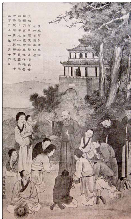
Čínské zobrazení blahoslaveného Odorika (kolem 1930)

Mohli tak učinit až při pohřbu, během něhož se udál zázrak, který všichni právem připisovali zesnulému menšímu bratrovi.