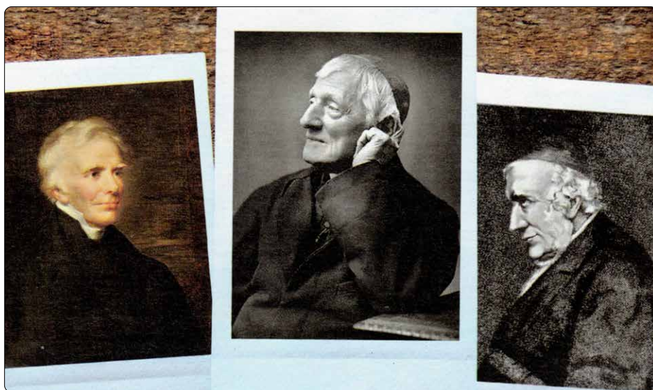
Iničiátoři oxfordského hnutí: John Keble, John H. Newman a Edward Bouverie Pusey

Pane, jsi svatý ve všech svých dílech. Hřích ve světě nepochází od Tebe – pochází od nepřítelů, pochází ode mne samého a z toho všeho, co je moje. Mne i všech lidí se týká tato hanba, poněvadž místo toho, abychom tíhli k dobru, poddali jsme se zlu. (...) Ty mě k sobě pozveš, až umřu, a budeš mým Soudcem. „Běda mi, jsem ztracen. Jsem člověk nečistých rtů a mezi lidem nečistých rtů bydlím.“ (Iz 6,5) Tvůj kříž, ó Pane, překlenuje propast dělící mě od Tebe. Hovoří o mé nehodnosti a o Tvém nepopsatelném odporu ke hříchu. Nauč mne, ó můj milovaný Pane a Spasiteli, abych chápal hluboký význam Tvého kříže a abych skrze Tvůj svatý kříž nejen pochopil, jak mě od Tebe hřích vzdaluje, ale abych dosáhl smíření s Tebou!