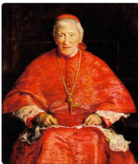
Lev XIII. v roce 1879 jako výraz uznání Newmanova přínosu v oblasti rozvoje teologického myšlení povolal Johna Henryho do kolegia kardinálů katolické církve

Kardinál varoval zkroušené hříšníky před netrpělivostí, aby si neordinovali přílišné množství modliteb a kajících skut-