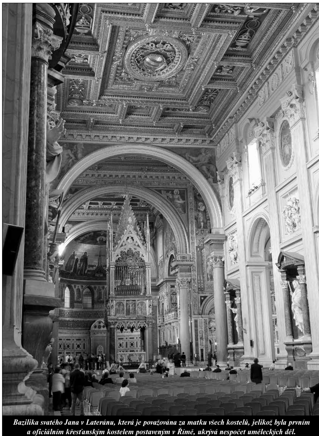
Bazilika svatého Jana v Lateránu, která je považována za matku všech kostelů, jelikož byla prvním a oficiálním křesťanským kostelem postaveným v Římě, ukrývá nespočet uměleckých děl.