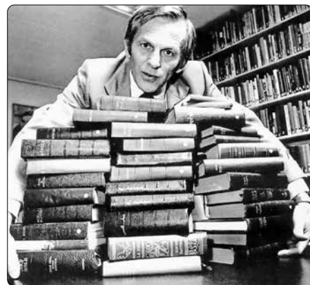
Holandský křesťanský misionář Anne (Andrej) van der Bijl (1928–2022)

Jak vzácné je Písmo svaté, to si člověk uvědomí zejména během pronásledování, kdy je téměř nemožné a riskantní ho získat, vlastnit či šířit. Svědčí o tom také holandský křesťanský misionář Anne (Andrej) van der Bijl (1928–2022), známý jako bratr Andrew, který s nasazením vlastního života začal v roce 1955 pašovat desetitisíce výtisků Bible za železnou oponu. To byl počátek mezinárodní organizace Open Doors vzniklé na pomoc pronásledovaným křesťanům.