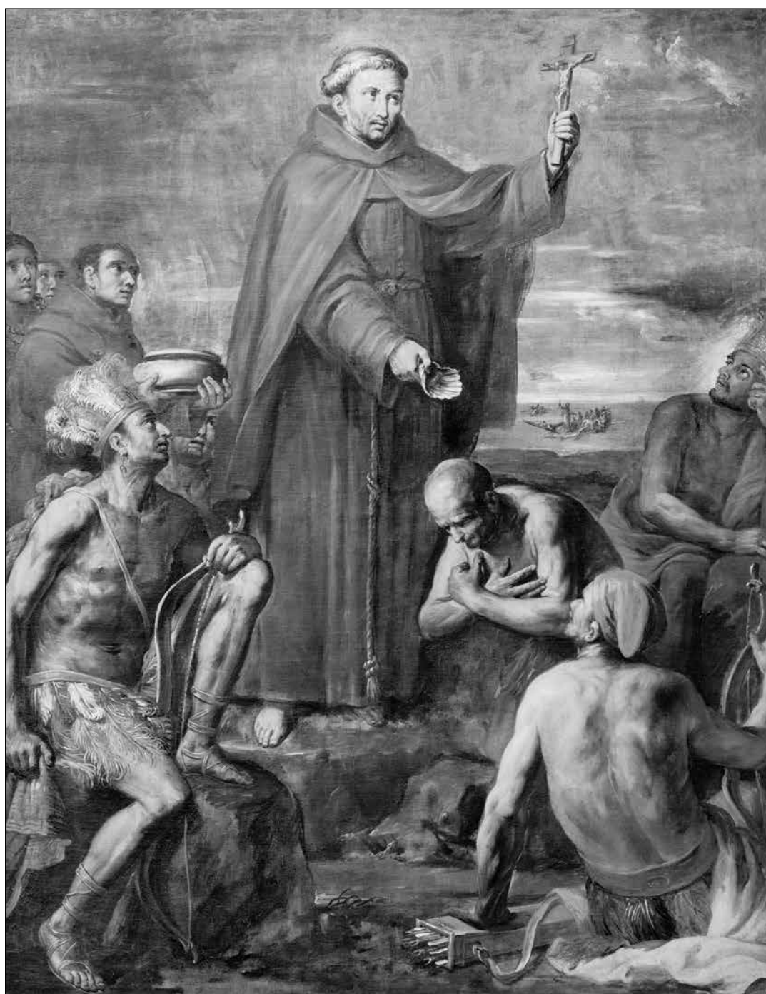
Giovanni Battista Carlone (1603–1684): Svatý František Solano křtí indiány (Basilica della Santissima Annunziata del Vastato, Janov, Itálie)