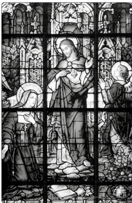
Vitrážní okno sv. Markéty Marie Alacoque v katedrále v Covingtonu

jevili vděčnost za moji lásku, všechno, co jsem pro ně udělal, bych považoval za maličkost - a udělal bych ještě mnohem více,