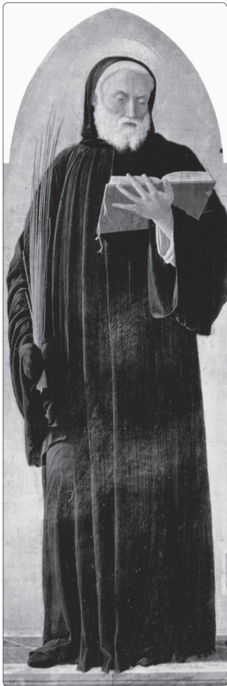
Andrea Mantegna (1431-1506): Svatý Benedikt z Nursie, detail z polyptychu svatého Lukáše, tempera na desce, 1453-1454, Galerie umění Brera

„Svatý Benedikt byl především muž Boží. Stal se tím, který následoval stále nitčností, které se uvádějí v evangeliu. Byl to pravý poutník Božího království a ta-