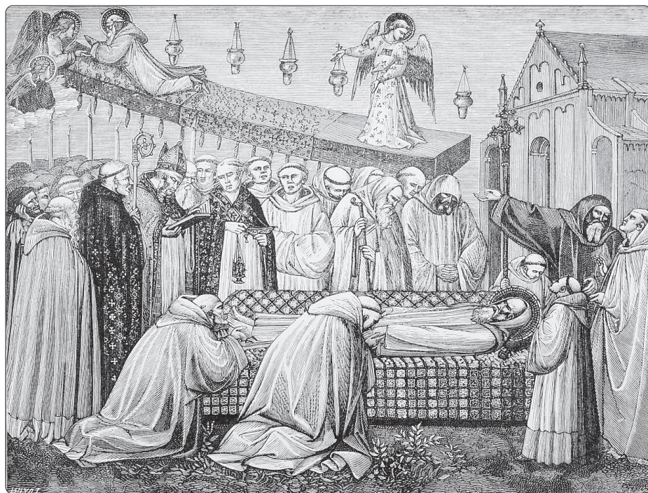
Smrt svatého Benedikta z Nursie v opatství Monte Cassino

Z Der Fels 3/2017 přeložil -mp- (Redakčně upraveno)