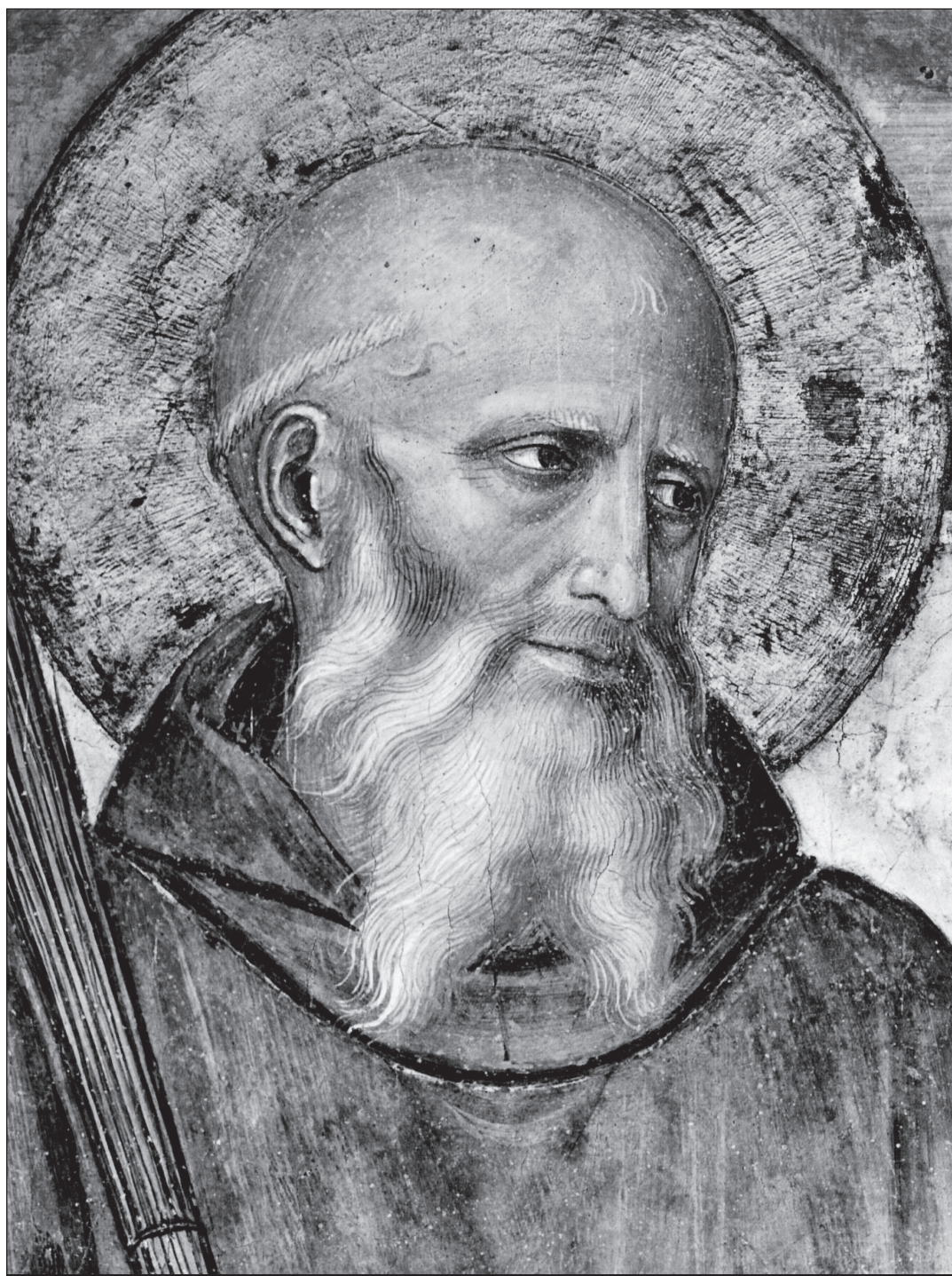
Sv. Benedikt z Nursie, freska od Fra Angelica, kostel San Marco, Florencia

Chléb svaté Zity (29 - dokončení) Silvia Koscelanská - strana 24 -