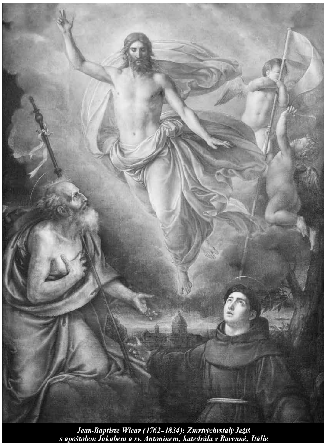
Jean-Baptiste Wicar (1762-1834): Zmrtvýchvstálý Ježíš s apoštolem Jakubem a sv. Antonínem, katedrála v Ravenně, Itálie