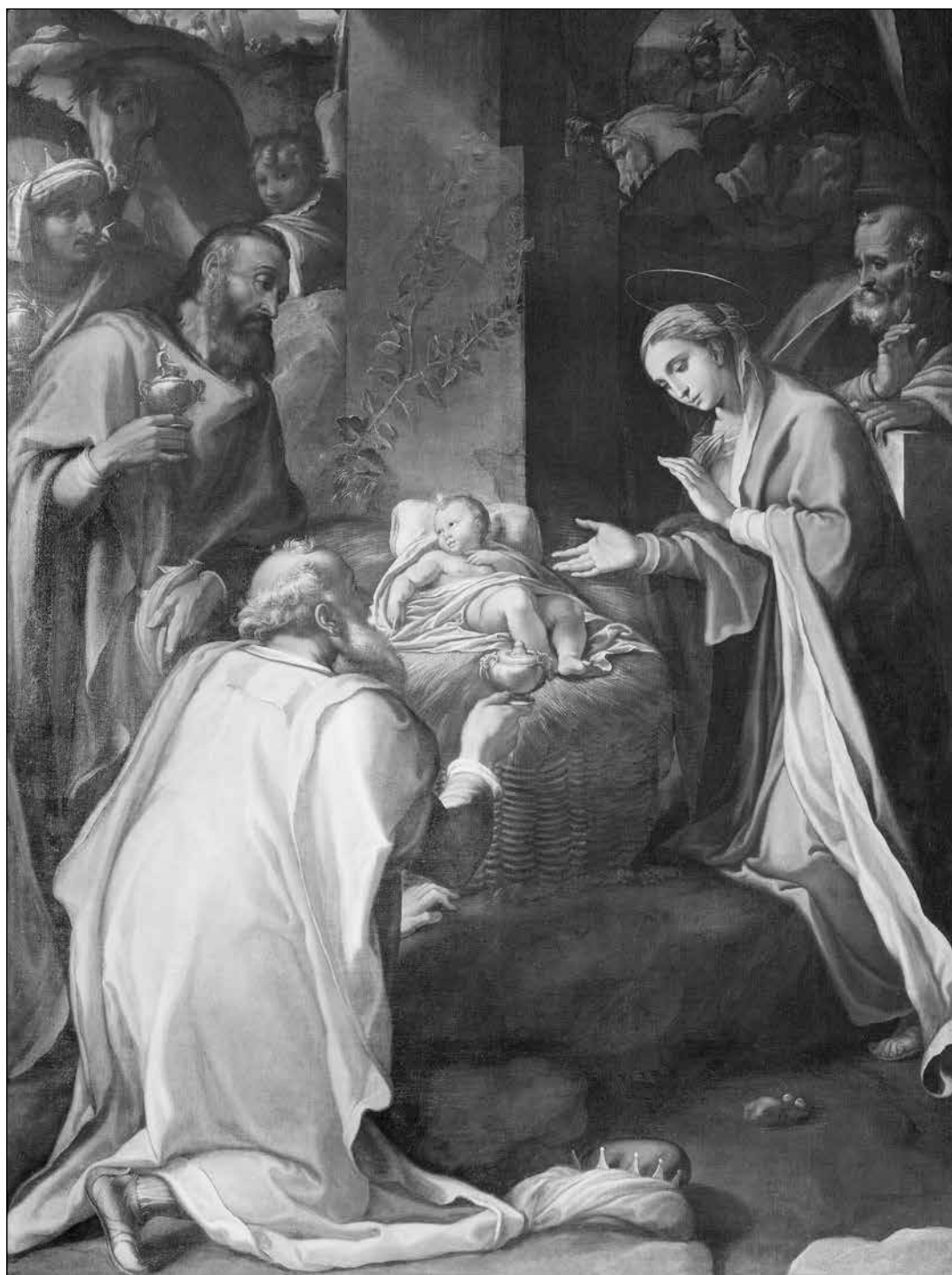
Klanění tří mudrců z Východu, obraz v kostele Chiesa Nuova, Řím

Uznán 71. zázrak v Lurdech - strana 13 -