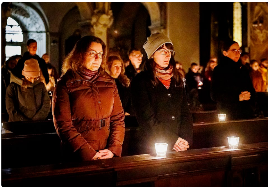
Studentské roráty, VKH Brno

V Římě nabyly advent vedle mesiánské i mariánské ladění. Missa aurea (Zlatá mše), ze které vznikly roráty, odkazuje na nejstarší mariánské svátky, které se v Římě slavily v adventní době. Snad nejstarší mariánský svátek vznikl kolem roku 300 ve východní církvi. Byl položen do adventní doby a jeho obsahem bylo Mariino panenské mateřství. Kolem roku 500 byl tento svátek převzat také v Římě