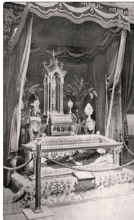
Ostatky sv. Jana v Lovani (Belgie)

Ale Jan je uklidnil, že nezemře, dokud se opět nevrátí, a dodal, že dokonce bude moci hovořit do poslední chvíle.