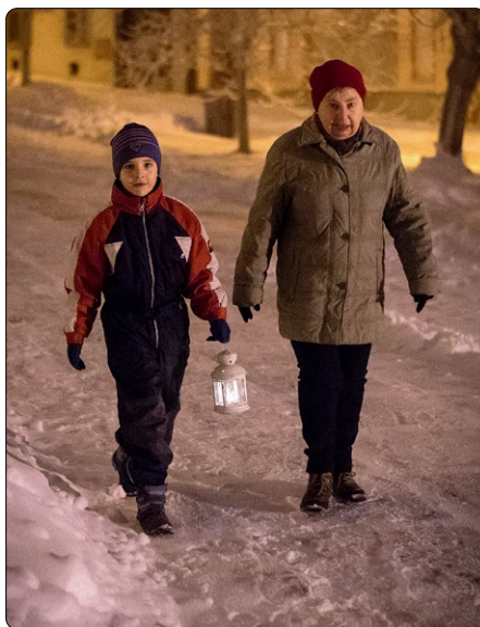
Cesta na rorátní mši svatou, Olešnice

Maria je předobraz svatosti a jako Matka Boží, která nese božské Dítě pod srdcem a dívá se vstříc jeho porodu, doprovází nás v adventní době jako nejdůležitější svatá postava, kterou uctíváme rorátními bohoslužbami. Z celého mariánského roku slavíme právě v adventu slavnost její-