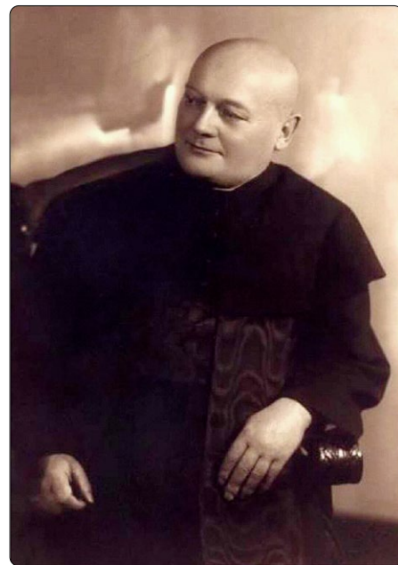
Blahoslavený Narcis Putz

Ovidius má ve svých skvostných „Proměnách“, zachycujících staré řecké báje, příběh o mladíkovi jménem Narkissos, obdařeném krásou. Věštec Teiresiás mu po narození předpověděl dlouhý život, ovšem za předpokladu, že „jen sebe když nepozná nikdy“. Narkissos se však poznal a bezhlavě se zamiloval do svého obrazu na vodní hladině. „Okouzlen krásou miluje beztělý přelud, [...] kolikrát do vody vnořil své paže, kterými dychtil obejmout spatřenou šíji, však nemohl zachytit sebe.“ Nemohl se od svého obrazu odpoutat a skončil špatně: sebeláskou a sebezhlázením zchřádl natolik, že na břehu zemřel vysílením. Na místě, kde spočinulo jeho tělo, vyrostla květina se žlutými okvětními lístky - narcis. Před sto lety žil kněz tohoto jména, jenž, okouzlen krásou Boží, miloval svého Pána a vztahoval k němu paže, jimiž ho dychtil obejmout. Beze stopy sebezhlázení zemřel z lásky k němu, a tím ho co nejpevněji zachytil.