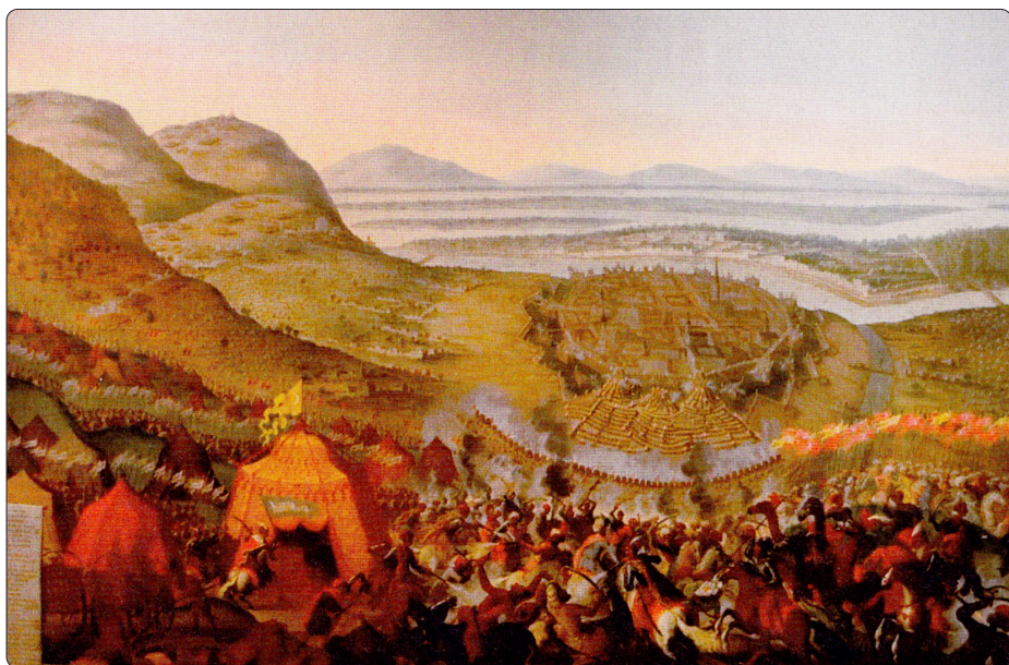
Franz Geffels (1625-1694): Obléhání Vídne Turky, 1683

Stalo se, jak mnich předpověděl: Sotva přešel rok – a turecké vojsko „tak veliké, jaké nikdo nikdy neviděl“, se převalilo přes Balkán k severu. Začalo dvouměsíční obléhání Vídne. Císař utekl do Lince a nechal povolat „zázračného mnicha“ z Itálie. Ten přednesl na tullnské rovině 8. září 1683 (o svátku Narození Panny Marie) spojeným vojskům pod vedením polského krále svoje ohnivé kázání: „Bez Boha