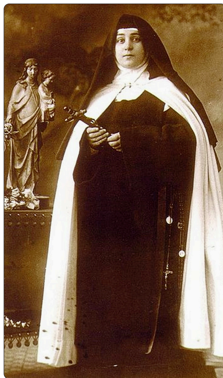
Blahoslavená Marie Sagrario od sv. Aloise z Gonzagy

Azyl u rodičů oné spolusestry byl 14. srpna revolučními bojůvkami odhalen. Rudé hordy vtrhly dovnitř a obě