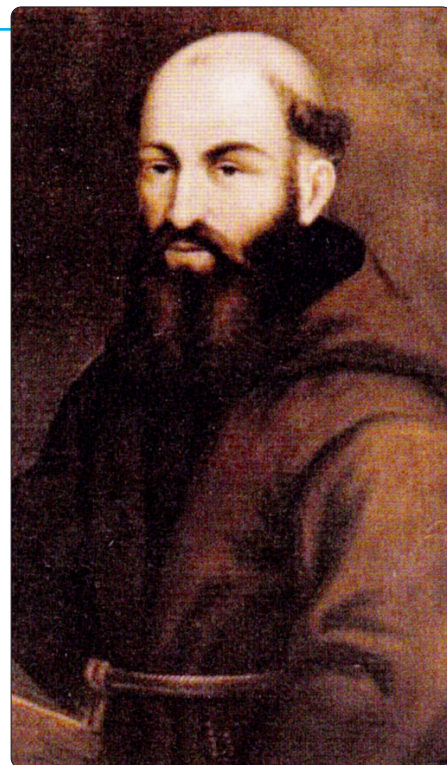
Bl. Marek z Aviana

Od tohoto dne se množila hlášení o zázračných uzdraveních. P. Marek neměl ani hodinu klidu: adventní a postní kázání, slavnostní a příležitostná kázání, nejprve v severní Itálii, potom také v německy a francouzsky mluvících zemích. Jeho slova byla doprovázena zázračnými uzdraveními.