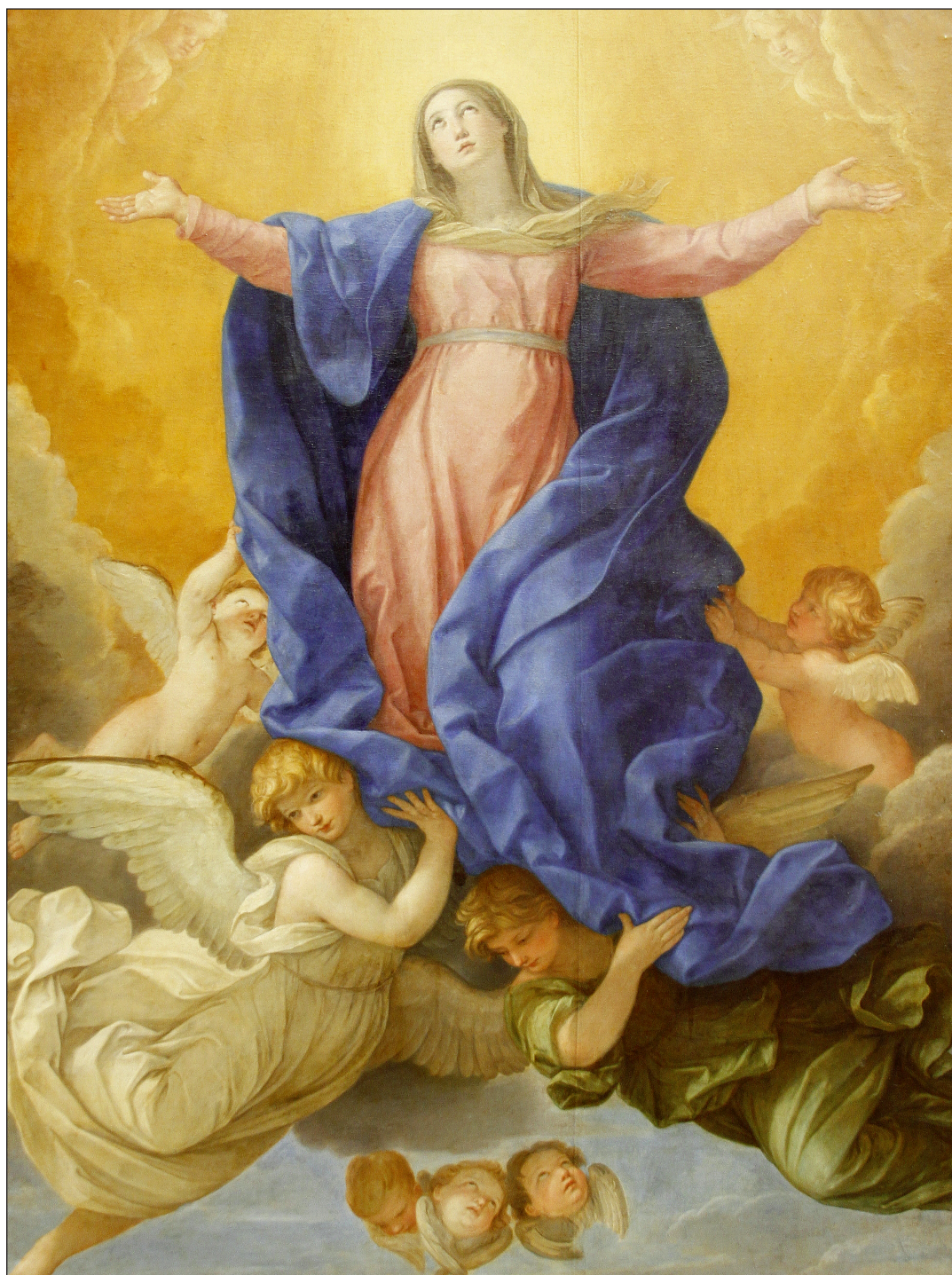
Guido Reni (1575-1642): Nanebevzetí Panny Marie