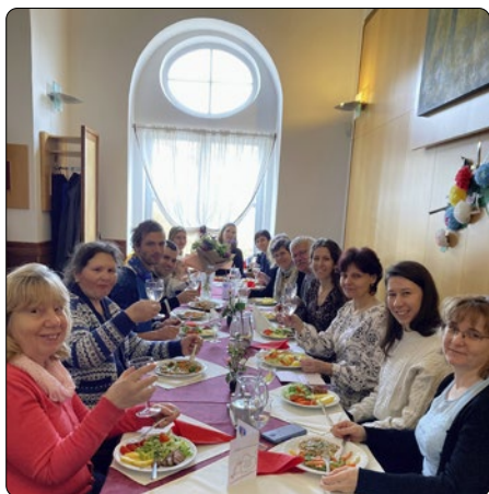
Posezení bývalých i současných zaměstnanců s následnou přednáškou o historii organizace CENAP

V Centru naděje a pomoci (Brno) si připomínáme 30 let od oficiální registrace. 30 let mravenčí práce v individuálních poradenstvích, účasti na různých kongresech, přednáškách v ČR i v zahraničí, 30 let pořádání odborných konferencí. Vše se zaměřením na pomoc v otázkách rodičovství, mateřství. Se zaměřením na podporu pěkného vztahu mezi mužem a ženou i mezigene-