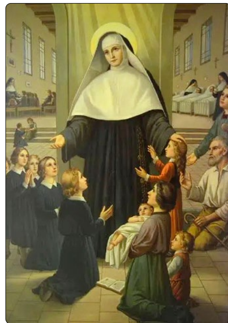
Svatá Jana Antida Thouretová