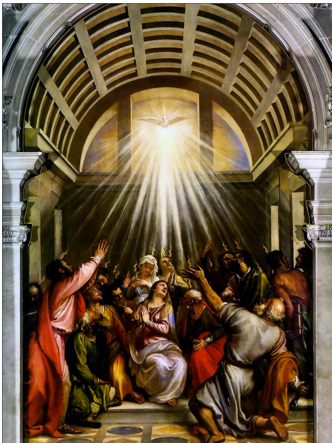
Tiziano Vecellio di Gregorio (kolem 1488/1490–1576): Sesláni Ducha Svatého