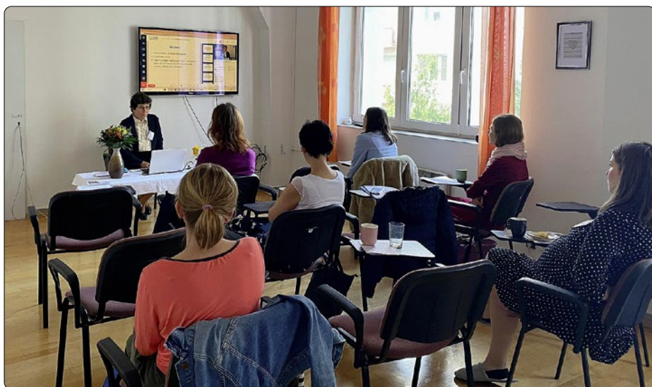
Konference CENAP – „Symptotermální metoda v managementu života ženy“