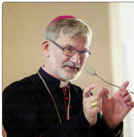
Biskup Clemens Pickel

prokázat, ale máme je. Jsou to děti, které od začátku svého života vyrůstají ve víře, byly pokřtěny jako miminka a později jako mladí lidé přijímají svátost birmování.