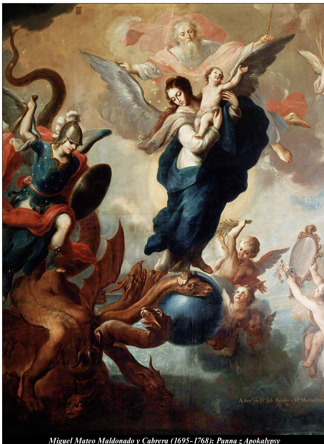
Miguel Mateo Maldonado y Cabrera (1695–1768): Panna z Apokalypsy