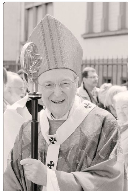
Joachim kardinál Meisner

Ženou, kterou nejvíce představuje naše západní kultura, je, Bohu díky, stále ještě Maria. Jí patří nejkrásnější a nejdokonalejší obrazy a sochy největších umělců všech dob. „Vidím tě, Maria, jak jsi libezně zobrazena v tisících obrazech,“ vyznává německý romantický básník Novalis. Dokonalé křesťanské lidství lidi přitahuje. Kdo jde k Marii, jde ke Kristu a může říct jako ona: Veliké věci mi učinil ten, který je mocný, a jeho jméno je svaté. (Lk 1,49)