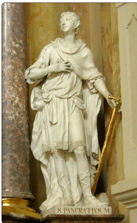
Socha sv. Pankráce v barokním kostele Narození Panny Marie ve Vranově u Brna

Pankrácova výslechu se účastnil sám císař Dioklecián, což bylo dáno jednak chlapcovou nezletilostí (císaři se mladiství odsouzení tohoto typu předsta-