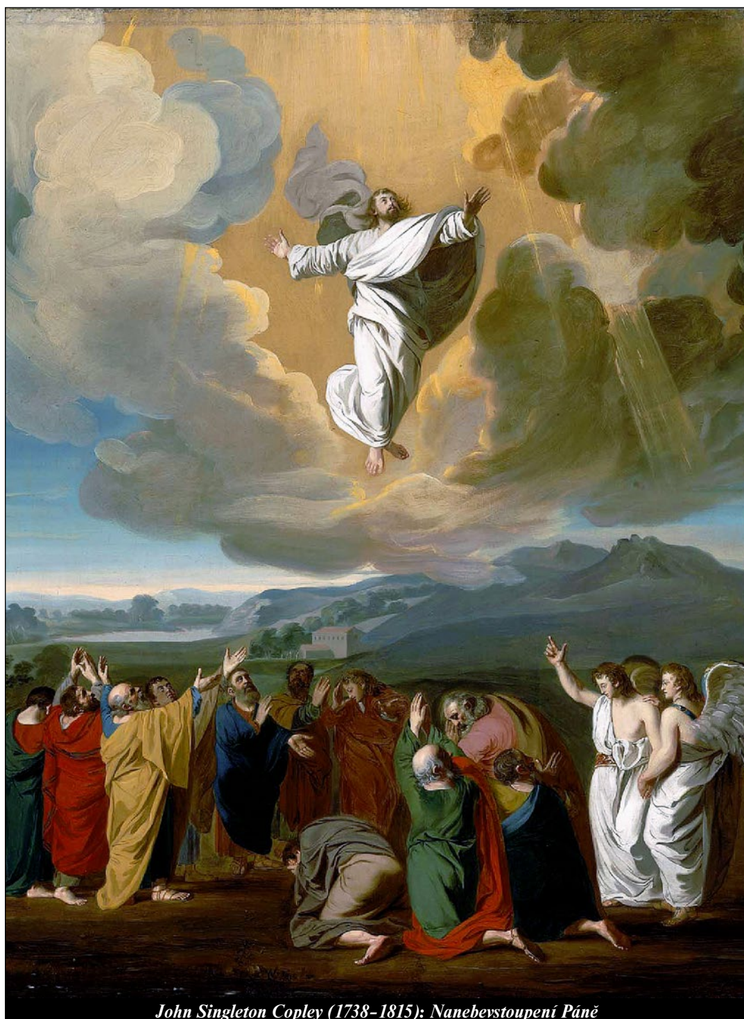
John Singleton Copley (1738–1815): Nanebevstoupení Páně