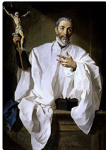
Pierre Hubert Sibleyras (1699–1749): Svatý Jan z Ávily