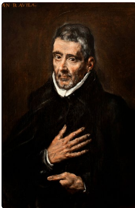
El Greco (asi 1541–1614): Svatý Jan z Ávily

Možná by stačilo uvést jen přezdívku, která k Janovi z Ávily patří, aby se ukázala míra jeho působení – Apoštol Andalusie. Nešlo jen o náplň jeho kázání, nýbrž i o způsob, jakým je pronášel. Janova plamenná kázání obracela srdce posluchačů, kteří slyšeli, že se mají navracet k Bohu, jenž „ sestoupil z výšin svého majestátu, aby vystoupal na výšinu kalvárskou “, bez čehož by „ lidé nadále zůstávali uvízlí ve své bídě a hanbě “. Tepal hřích, zlořád, lidskou laxnost, pohodlnost a nevděčnost, jejichž vinou člověk nemiluje vtělenou Lásku; hlásal Boží úžasnost a slávu, vyzýval k pokání. To vše s pravým jižanským temperamentem, jímž rozehříval srdce své i těch, kdo jeho kázáním naslouchali. Nabývali pokorného přesvědčení o vlastní nedostatečnosti a o to více si cenili výkupné oběti Spasitelovy a přilnuli k němu s láskou o to větší – a učit milovat Boha bylo Janovou usilovnou snahou.