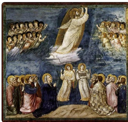
Giotto (asi 1267-1337): Nanebevstoupení Páně

Právě proto nám zpráva o Kristově nanebevstoupení říká: „Jdeme tou měrou k nebi a přímo do nebe, do jaké míry jdeme k Ježíši Kristu a vstupujeme do něho.“ (4) Cesta s Bohem a k Bohu, cesta k plnosti života a lásky v Trojjediném Bohu je otevřena v Kristu a skrze Krista. To nám dosvědčuje nanebevstoupení Pá-