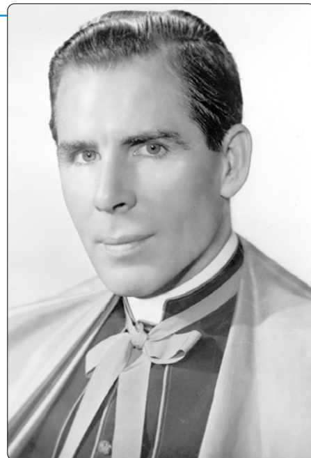
Ct. Fulton J. Sheen

Celibát doporučuje jako moudřejší cestu, ale nežádá ji od většiny. Později Petr opustil svoji manželku, aby mohl ohlašovat evangelium. Když Pán radil celibát, je velice pravděpodobné, že učedníci jeho radu nevztahovali na sebe, spíše měli