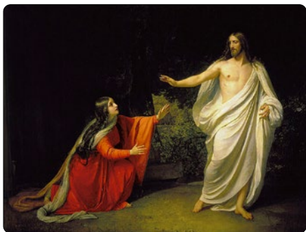
Alexandr Andrejevič Ivanov (1806-1858): Zjevení Krista Marii Magdaleně

Jestliže autoři Nového zákona nemluví o setkání Matky se zmrtvýchvstalým Synem, bylo tomu snad proto, že takové svědectví by mohlo být ze strany těch, kteří