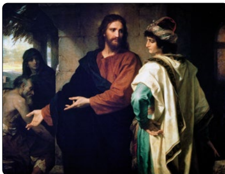
Heinrich Hofmann (1824-1911): Kristus a bohatý mládenec

„Chceš-li být dokonalý, jdi, prodej, co ti patří, rozdej chudým, a budeš mít poklad v nebi; pak přijď a následuj mne.“ (Mt 19,21)