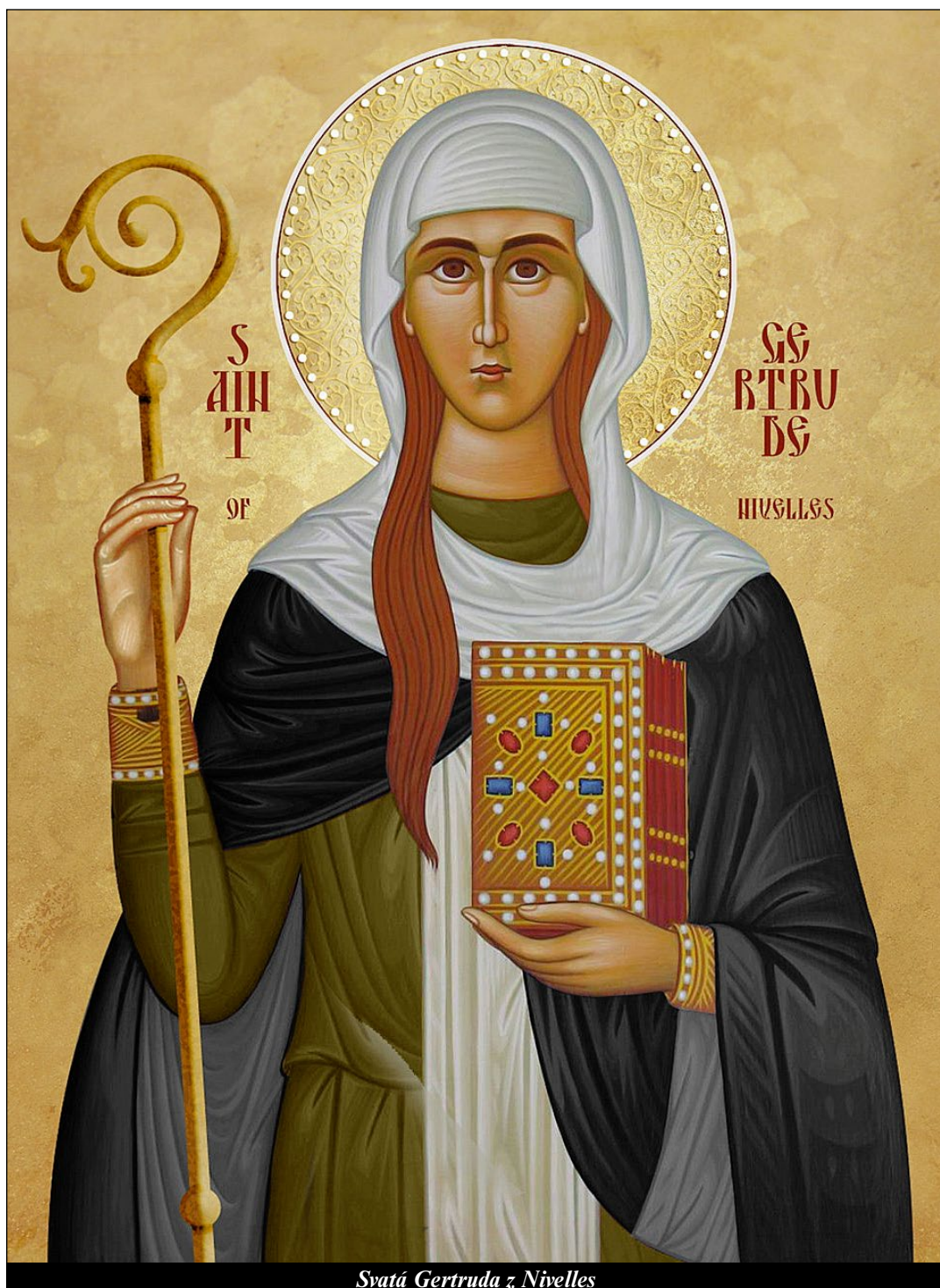
Svatá Gertruda z Nivelles