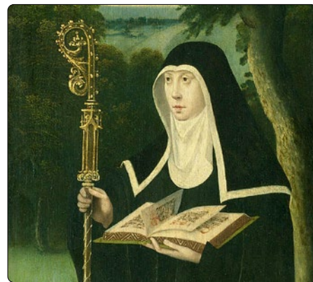
Svatá Gertruda z Nivelles