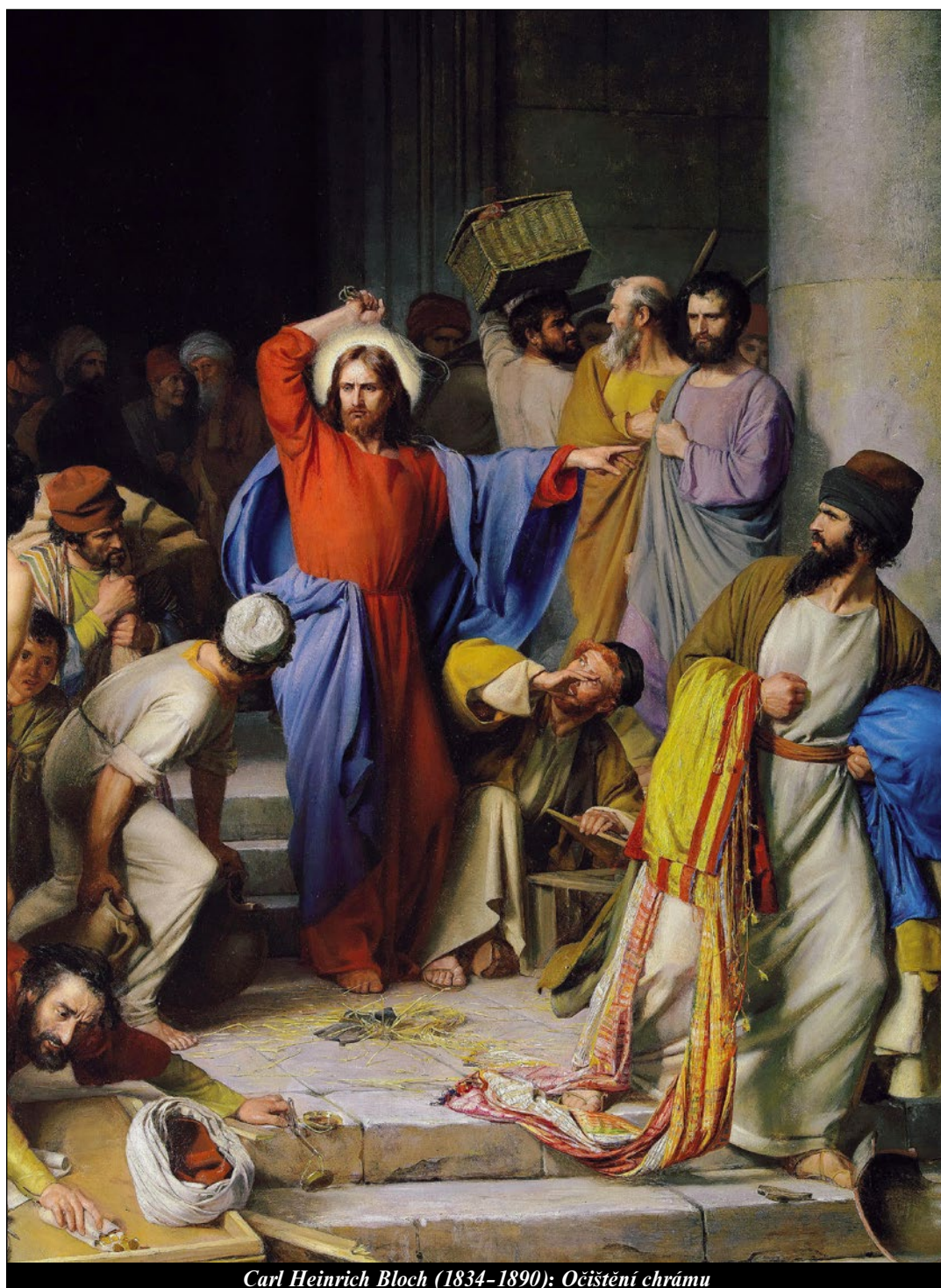
Carl Heinrich Bloch (1834–1890): Očištění chrámu