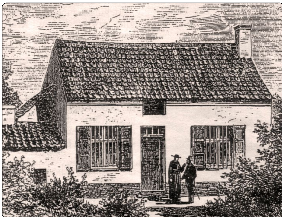
Luisin rodný dům

Z Maria heute 11/2003 přeložil -Iš- (Redakčně upraveno)