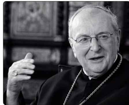
Kardinál Joachim Meisner

Svátosti nejsou uměle naočkovány do našeho přirozeného života, ale plně odpovídají přirozenému průběhu života a naplňují ho. Mnozí lidé se dnes dusí sebou samými. Proto mohou mluvit jen sami o sobě, myslet jen na sebe, hrát jen o sebe. Největším dobrodiním by však pro ně bylo, kdyby se mohli bez zábran vyslovit. Vyslovení se, rozhovor, je Kristem zvolená vnější podoba svátosti smíření. Ve zpovědi je kněz povinen mlčet, aby naslouchal, a člověk má možnost vyjádřit se po důkladném zkoumání se-