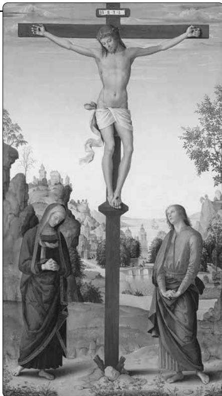
Pietro Perugino (1446–1524): Bolestná Panna Maria u ukřižovaného Krista

Ale ani to ještě nebyla ta nejhorší bolest, protože tu působily samotné hřeby. Horší než hřeby v nohou byly hřeby, které procházely rukama. Vojáci věděli velmi dobře, na rozdíl od většiny uměleckých zobrazení, že ukřižované tělo by neuneslo hřeby, kdyby procházely jen dlaněmi. Tká-