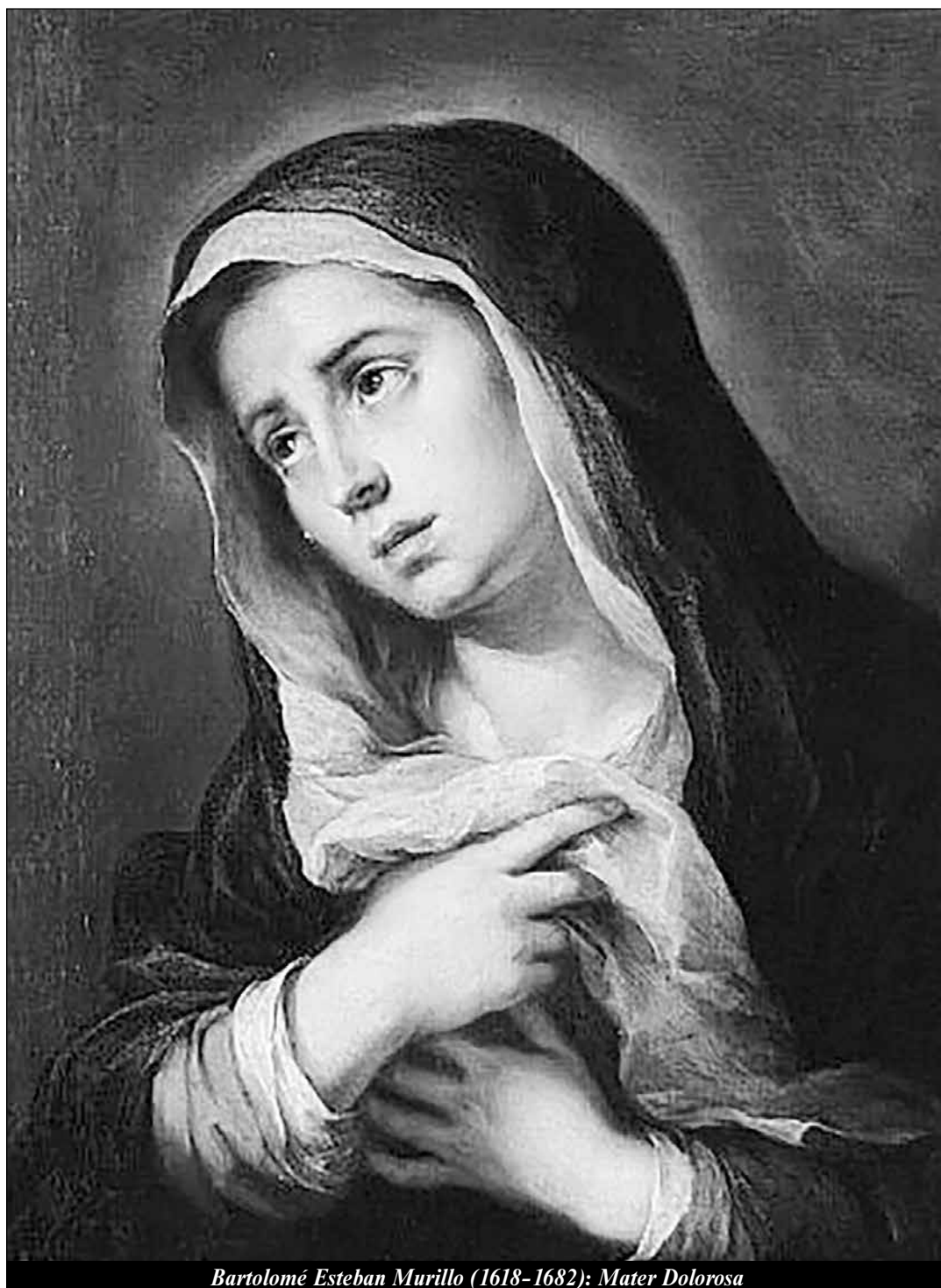
Bartolomé Esteban Murillo (1618-1682): Mater Dolorosa