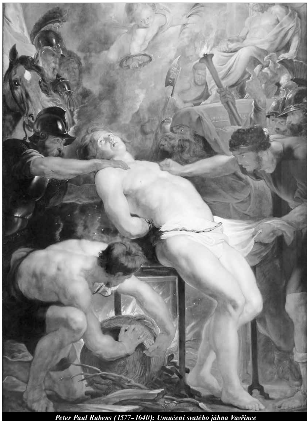
Peter Paul Rubens (1577-1640): Umučení svatého jáhna Vavřince