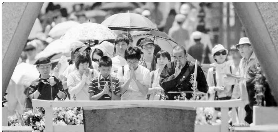
V Hirošimě se každoročně 6. srpna koná vzpomínkový den