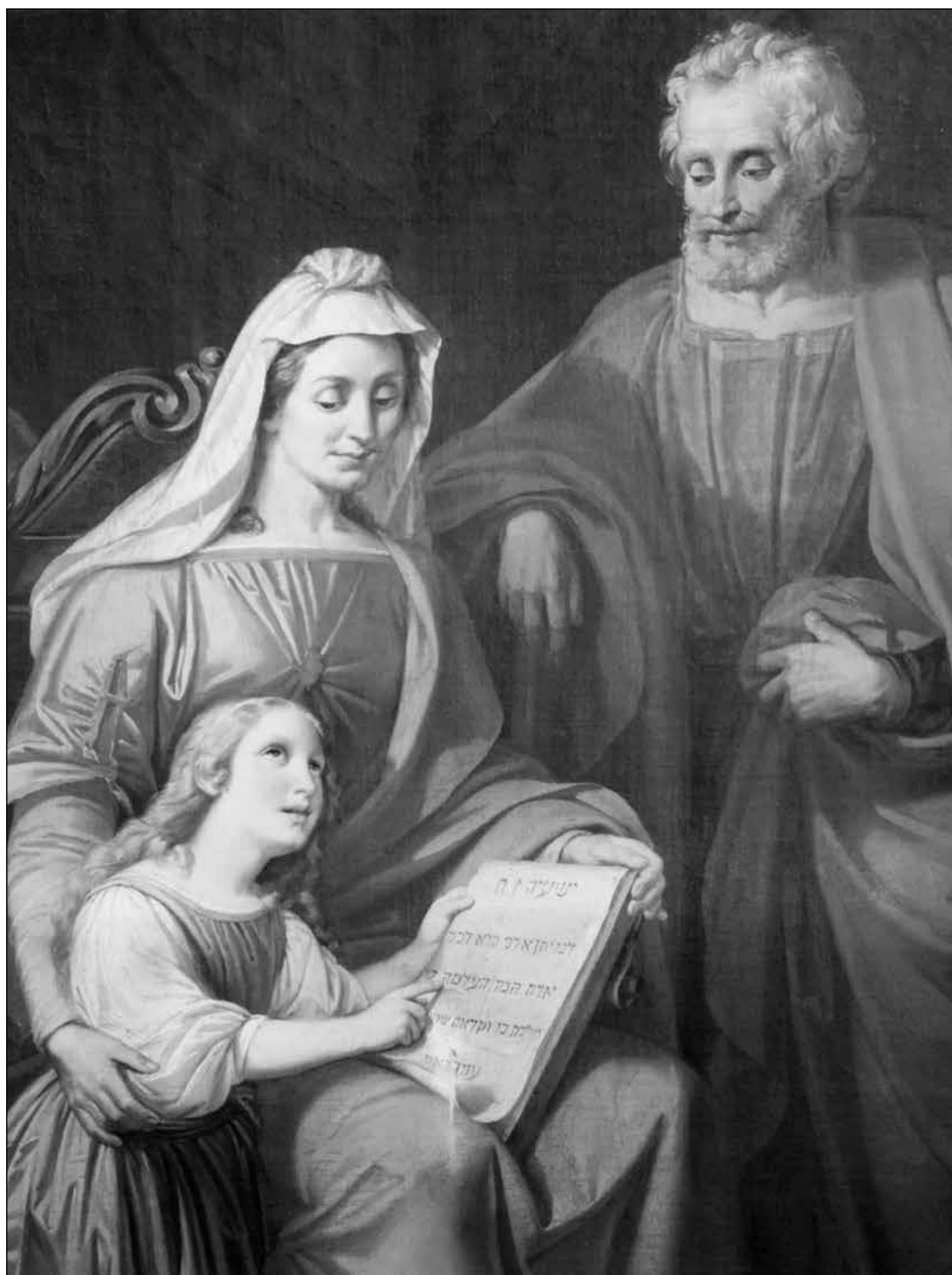
Svatý Jáchym, Panna Maria a svatá Anna, obraz v kostele sv. Františka, Reggio Emilia, Itálie