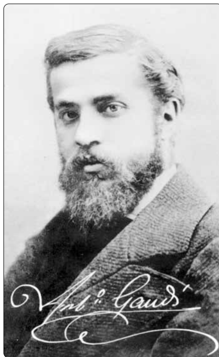
Antoni Gaudí a jeho podpis

Gaudího jedinečný styl – směs gotiky, secese a pestrobarevného katalánského keramikářství – který v průběhu let permanentně rozvíjel, přičemž pracoval na vícero stavebních projektech současně, – vyvrcholil právě v návrzích chrámu Sagrada Família . Od počátku měl však tento jemnocitný tvůrce na paměti základní myšlenku stavby – odčinění, usmíření: „Tento chrám je smírným kostelem. To znamená, že se žíví oběťmi.“ Katolík Gaudí se vzdal svého pohodlného způsobu života a díky přátelství, které ho spojovalo s kněžími a biskupy, stále hlouběji chápal, že věrnost pravé nauce církve je oním skutečným řešením problémů doby. Proto zcela vědomě korunoval mnohé své stavby, církevní i světské, čtyřramenným křížem, na nějž často připevňoval písmena JMJ – iniciály jmen Ježíš, Maria, Josef. V roce 1894 ještě zintenzivnil svůj život modlitby a studia Písma svatého, začal se přísně postit a žít bez jakýchkoliv nároků. Při každodenní mši svatě zasvětil celý svůj život a celé své dílo Bohu, jehož po-