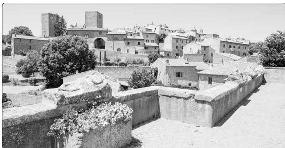
Tuscania, malebné starobylé město v Itálii

Z Vítězstvo Srdca 157/2024 přeložil a upravil -dd-