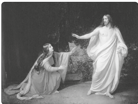
Alexandr Andrejevič Ivanov (1806-1858): Zjevení Krista Marii Magdaleně

Jestliže autoři Nového zákona nemluví o setkání Matky se zmrtychvstalým Synem, bylo tomu snad proto, že takové svědectví by mohlo být ze strany těch, kteří