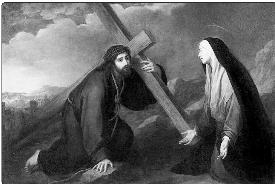
Bartolomé Esteban Murillo (1618-1682): Kristus nesoucí svůj kříž