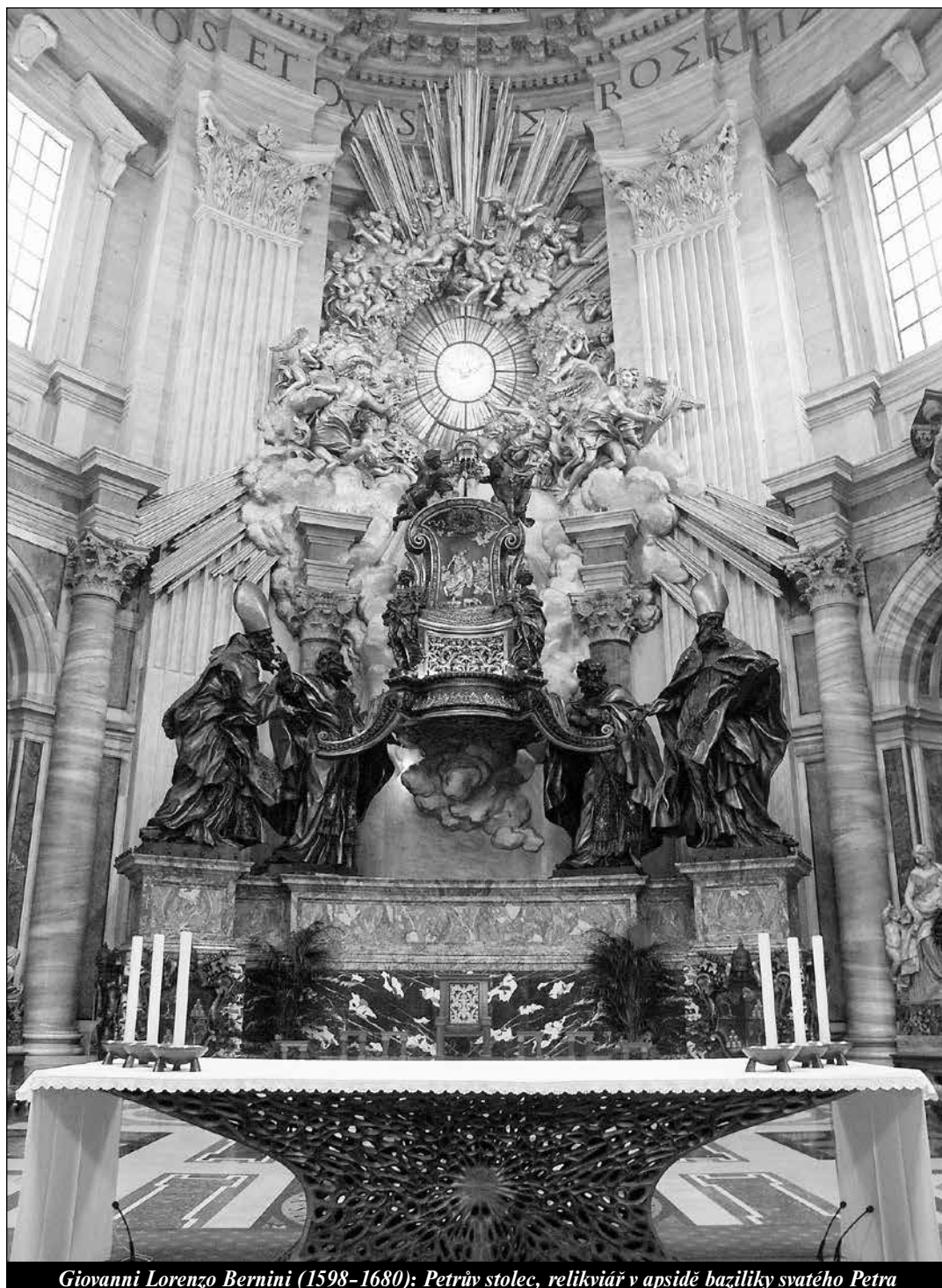
Giovanni Lorenzo Bernini (1598-1680): Petrův stolec, relikviář v apsidě baziliky svatého Petra