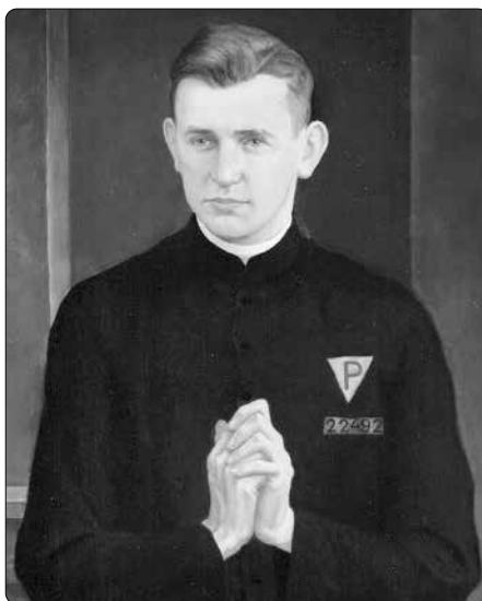
Blahoslavený Stefan V. Frelichowski

V očích okupantů byl podezřelý kvůli své angažovanosti v harcerském hnutí, jehož dvěma pilíři byly víra a patriotismus. Dočasným působištěm P. Vincenta se stal Fort VII, což bylo vězení vytvořené ze součásti někdejšího toruňského opevnění. Slovo „působiště“ není použito nahodile – na každém svém vězeňském místě si rodák z Chlumže počínal podle slov spoluvězňů tak, jako by šlo o farnost, do níž ho poslal jeho biskup. Věnoval se zde mládeži, která v těchto trudných okamžicích potřebovala duchovní pomoc více než kdy jindy. Samozřejmě nejen jí, byl