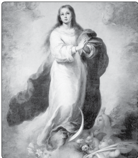
Bartolomé Esteban Murillo (1617-1682): Neposkvrněné Početí

I v nás se musí stále znovu uskutečňovat vítězství nad hadem. V Marii tušíme