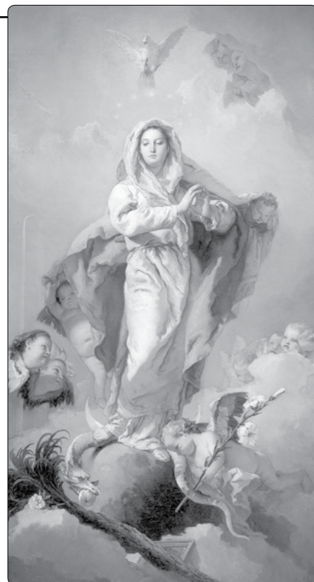
Giovanni Battista Tiepolo (1696-1770): Immaculata

Za druhé naše viny poškozují naši osobnost. Naše špatné skutky kazí ten obraz, který vedl ruku Mistra. Zneužíváme svou svobodu v tom, že odmítáme něco z toho, v čem bychom se měli dát k dispozici božské lásce, která je nezbytná pro to, abychom se rozvíjeli k vyššímu stupni milosti. Potřebujeme stále polepšení: naše svobodné skutky nejsou v souladu se zákony našeho bytí; selháváme v tom, co Bůh od nás očekává. Svatý Pavel říká, že jsme byli stvořeni k tomu, abychom byli Božími dětmi, a to ještě dříve, než byly