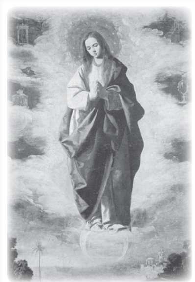
Francisco de Zurbarán (1598-1664): Neposkvrněné Početí

Neposkvrněná a nejsvětější Panno, nejčistší Matko, která jsi působením Ducha Svatého porodila Syna věčného Otce, věčný chrám božské Trojice, buď pozdravena. Ty jsi požehnaná mezi všemi ženami, Bůh tě učinil tou nejblaženější, protože skrze tebe naplnil celou zemi svou vznešeností a majestátem. Svatá Panno, ty jsi vzešla světu jako jasné červánky, které nám přinesly Slunce vznešenosti. Skrze tebe byla zaplácena strašlivá noc temnoty, zlomena moc tyranů, zničena smrt, poraženo peklo, zrušeno nepřátelství mezi Bohem a člověkem, zajištěn mír, uzdraveny nemoci duše milostí svatosti a celý svět zazářil nejjasnějším světlem pravdy. Buď pozdravena, Panno Maria!