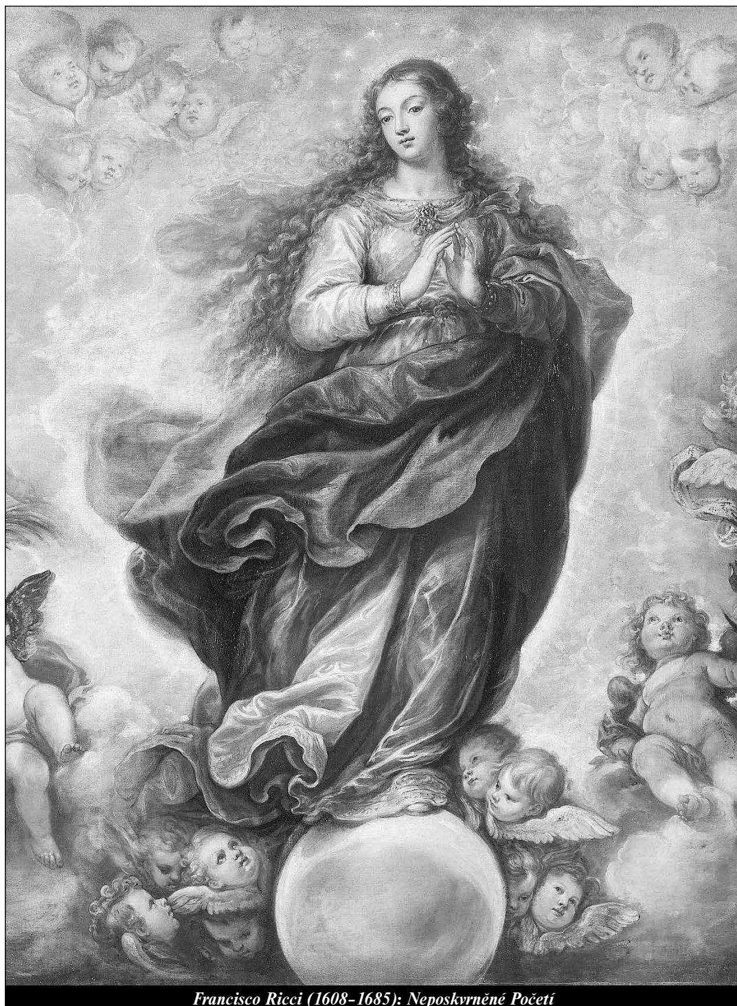
Francisco Ricci (1608-1685): Neposkvrněné Početí