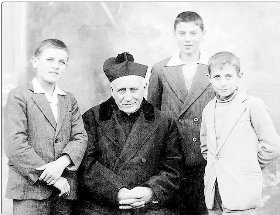
Blahoslavený P. Filip Rinaldi

v letech 1924 (Šaštín) a 1927 (Fryšták) na dálku stál. Beatifikační proces přitom započal relativně pozdě. Důvod ozřejmil jeho nástupce v čele kongregace, Don Pietro Ricaldone: „Celý život se snažil na sebe neupozorňovat, proto se na proces jeho blahorečení nemyslelo. Byl jsem o tom přesvědčen do té míry, že jsem žadatelem o zahájení procesu blahorečení odpovídal: »Svěřme to Pánu Bohu. Jestliže bude chtít oslavit svého sluhu, dá nám to nějakým způsobem určitě najevo.«“