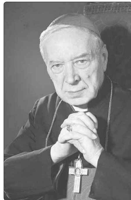
Bl. kardinál Stefan Wyszyński

Tento krátký popis dává jistotu ve věci, která spočívala v tom, že za nevinně znějícími slogany liberální hnutí a „v utajení“ působící zednářství se snažily za pomoci dalších akcí na podporu laicizace prosazovat radikální omezení základních lidských svobod občanů skutečně věřících v Krista a jsoucích součástí jím založené církve. Heslo připomenuté bl. kardinálem Stefanem Wyszyńským „svobodná církev ve svobodném státě“ (zni to pěkně, že?) pochází od italského liberálního politika a v zednářské hierarchii vysoce postaveného Camilla Cavoura (1810–1861). Jako ministerský předseda Piemontu na počátku druhé dekády 19. století však vedl politiku, která směřovala k přímému podřízení církve zbavením majetku, který zajišťoval její materiální nezávislost, zbavení církve působnosti ve školství a k likvidaci množství řeholních domů.