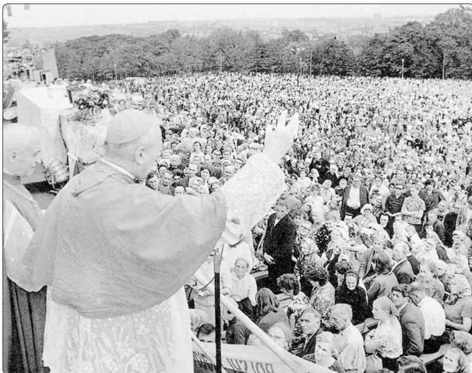
Oslavy milénia křtu Polska na Jasné Hoře 15. 8. 1966

kých „kulturních“ zápasů (kulturkampů), ohánějící se heslem „oddělení církve od státu“. Jak si povšiml bl. Primas tisíciletí, je to heslo z gruntu falešné. „Dnes předhazované heslo »oddělení církve od státu« je pokusem nastoupit linii: zde je církev, tam je stát – to znamená národ. Zkuste to udělat, uvidíte, jestli se vám to podaří. Bude to práce zcela nerozumná, jako byste chtěli živého a žijícího člověka rozdělit a říci: tady je duše, tady tělo. A přece všude je duše a všude je tělo. (...) To, co je propojené v člověku, duch i tělo, musí mít svůj odraz v dalších plánech: rodina, národ, stát, život společenský, pracovní, kulturní – další věci člověka žijícího ve velké mezinárodní rodině.“ (Čenstochová, 27. 11. 1966)