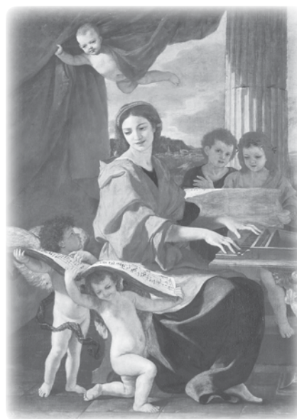
Nicolas Poussin (1594-1665): Svatá Cecílie

ti při vzájemném a společném postupu jeho údů.