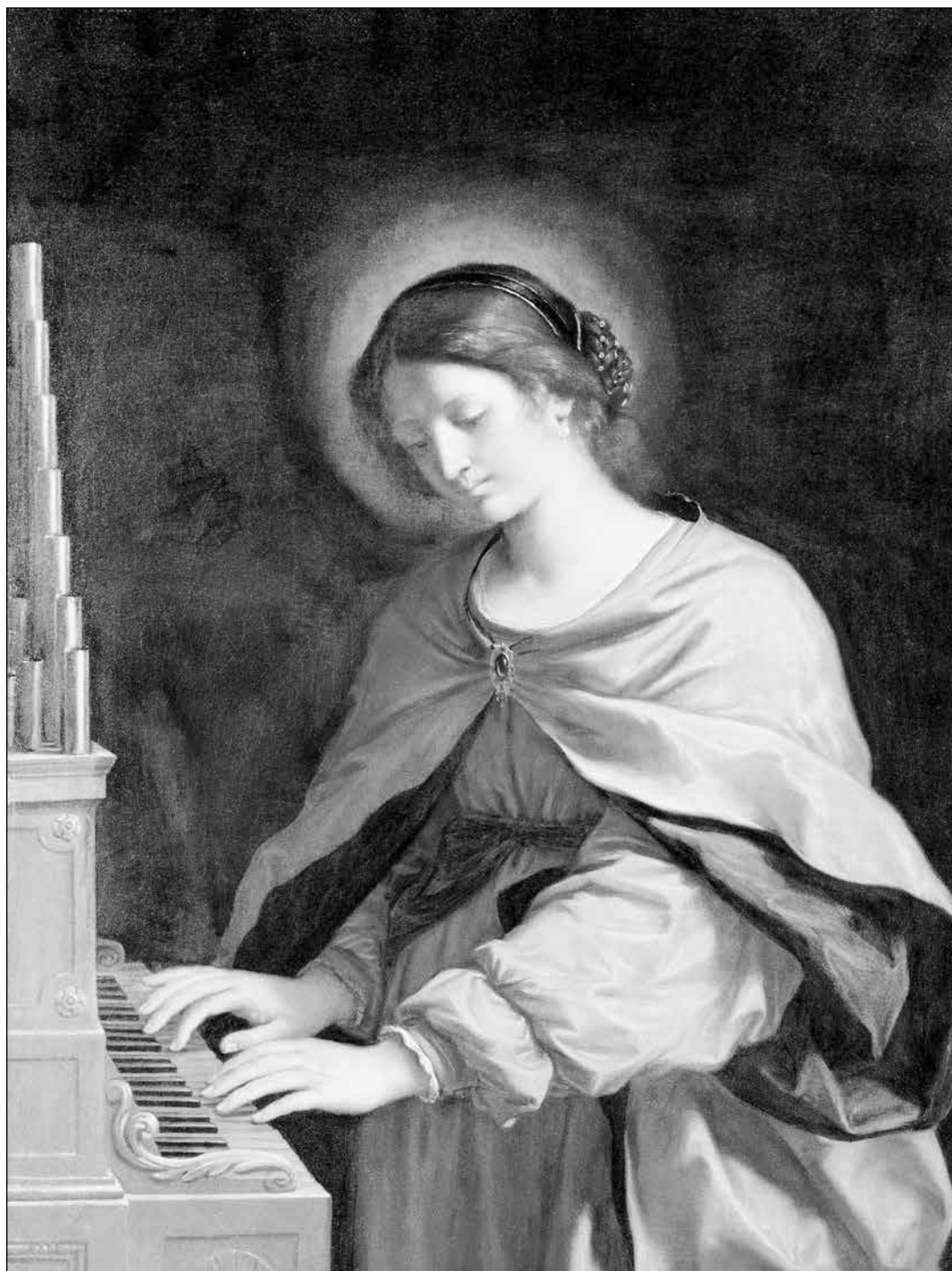
Giovanni Francesco Barbieri (1591-1666): Svatá Cecílie hrající na varhany