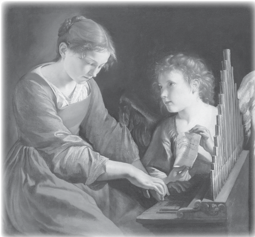
Orazio Gentileschi (1563-1639) a Giovanni Lanfranco (1582-1647): Svatá Cecílie a anděl

Bože, milostivě vyslyš naše prosby a na přímlovu svaté Cecílie nás naplň radostí, abychom ti ve svém srdci zpívali chvály. Amen.