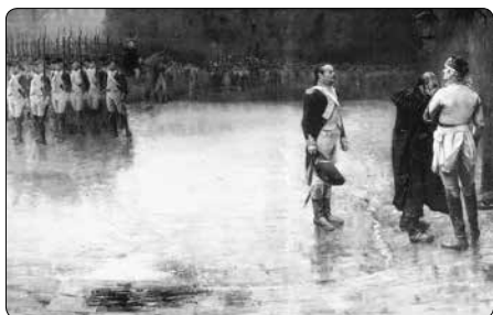
Julien Le Blant (1851-1936): Exekuce generála de Charetteho

Do poloviny června 1793 Armáda katolická a královská ovládla téměř celé Vendée. Středobodem úspěchů povstaleckých vojsk bylo dobytí Angers 18. června 1793. Obratem v celé válce se ukázal neúspěšný útok Vendéských na Nantes. Jeho dobytí by umožnilo pomýšlet na spojení se s Británií, rovněž nespokojenou s novými revolučními pořádky. Dne 29. června 1793 byl smrtelně zraněn během úto-