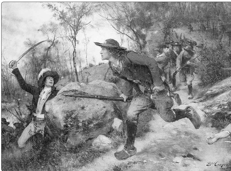
Évariste Carpentier (1845–1922): Ve Vendée - 1795

Vendéeští bojovali doma. To byla jejich výhoda, zvláště v první fázi bojů, kdy navíc ještě působil moment překvapení. V době vypuknutí povstání bylo Vendée zalesněnou provincií, kde bylo snadné se ztratit, jak vzpomínal generál Jean-Baptiste Kléber, vůdce vojska republiky Vendée, na terén, v němž měl působit: připomínal „nějaký temný, hluboký labyrint, ve