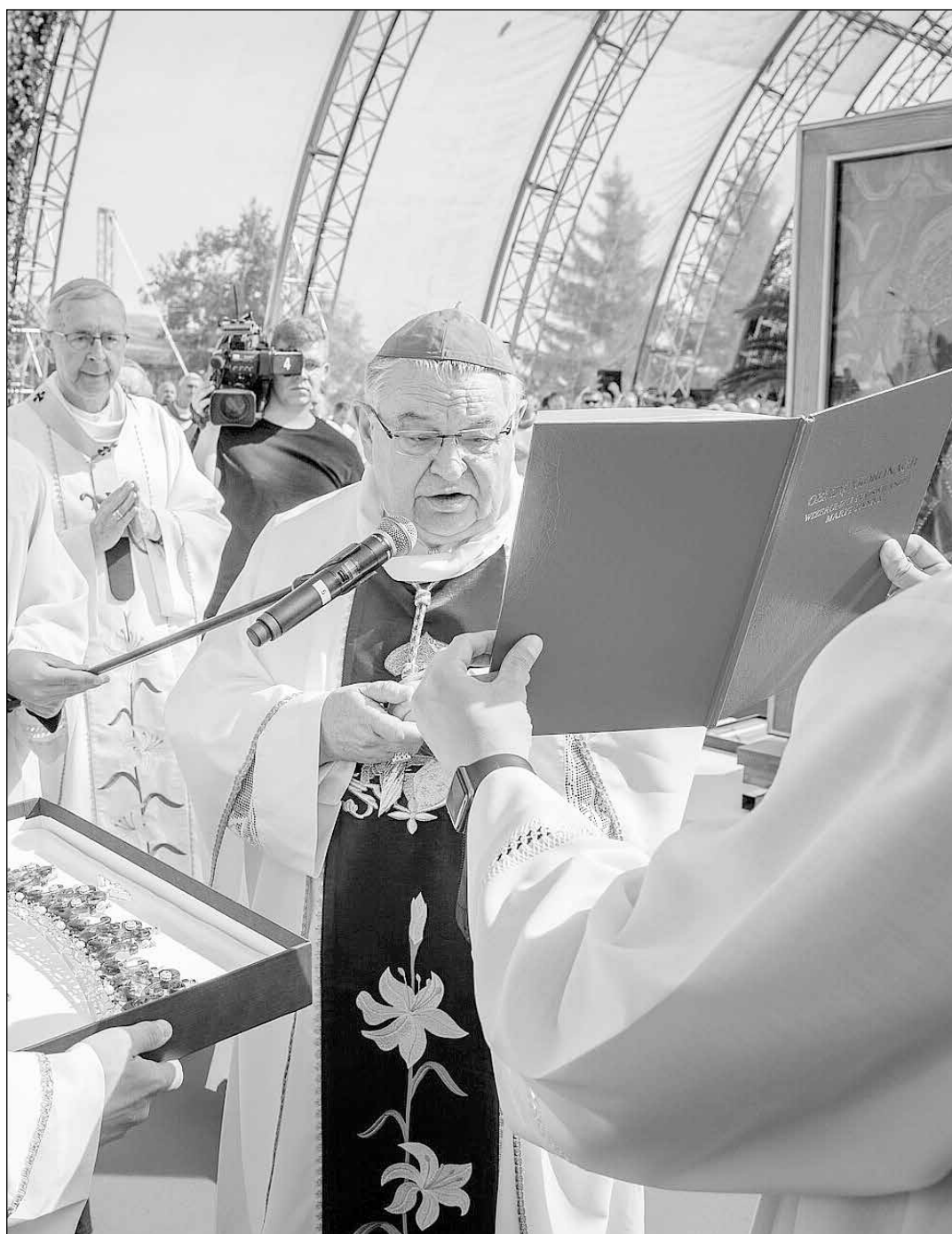
Kardinál Dominik Duka jako papežský legát 9. září 2023 vykonal slavnostní korunovací obrazu Panny Marie ve Smolicích v poznaňské arcidiecézi.