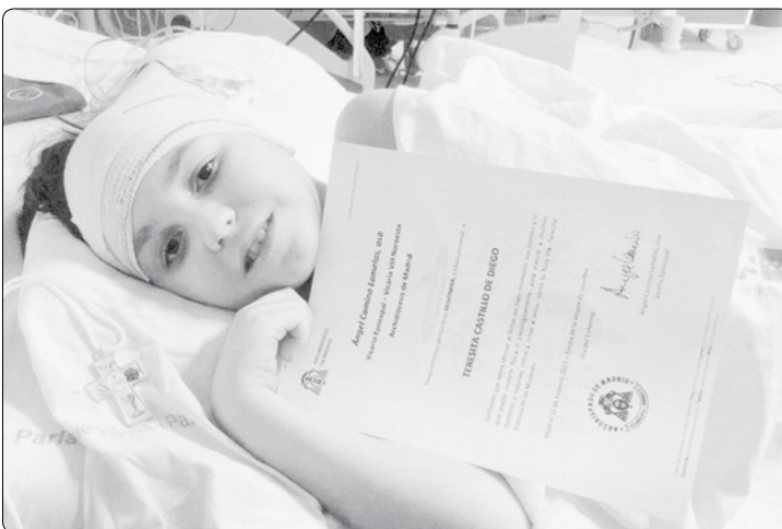
„Modlím se, aby mnohé děti poznaly Ježíše.“

Pozdravil jsem ji a vysvětlil jí, že jsem přišel jménem pana kardinála, arcibis-