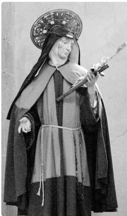
Svatá Marie Františka od pěti ran Ježíšových