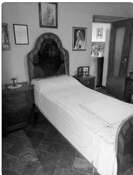
Rodná světnička vizionáře v Dongu

Naše cesta do Itálie po třech letech začala u hrobu zesnulého Dona Stefana Gobbiho na hřbitově ve městě Dongo, ležícím na břehu jezera Como na severu Itálie. Cesta přes švýcarské Alpy by-