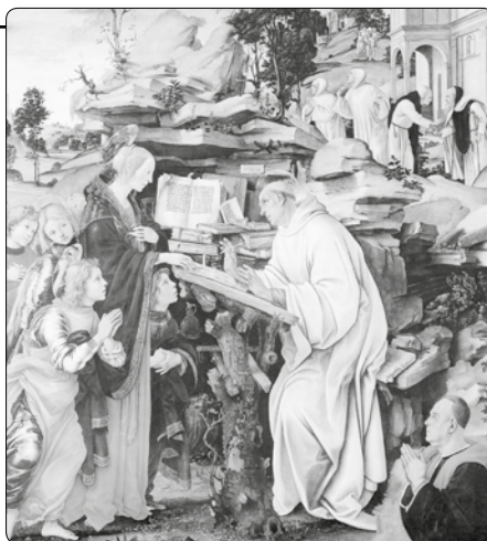
Filippino Lippi (1457-1504): Zjevení Panny Marie sv. Bernardovi

Bernard je pravým trubadúrem Panny Marie. Jako bylo v jeho době nejvznešenější povinností rytíře chránit urozené dámy a dvořit se jim, tak také on opěvuje velikost a krásu Paní svého srdce: „ Odstraň Marii, tuto mořskou hvězdu, hvězdu velkého a nebeského moře, co zůstane, když ne hustá mlha a stín smrti a nejtemnější temnoty? “ Matka Pána Ježíše, Matka Vykupitele se měla pro svoji mimořádnou účast na oběti svého Syna podle Božího plánu spásy stát Matkou všech lidí, a proto má i toto jedinečné povolání – být zprostředkovatelkou všech milostí, protože Vykupitel do ní „ bez míry vložil všechny svoje poklady “. Proto nás Bernard vyzývá: „ Celým svým srdcem, celou vroucností své mysli, celou svojí oddaností uctíváme Marii, protože je to vůle toho, který chtěl, abychom měli všechno skrze Marii. “