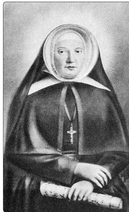
Svatá Emílie de Vialar