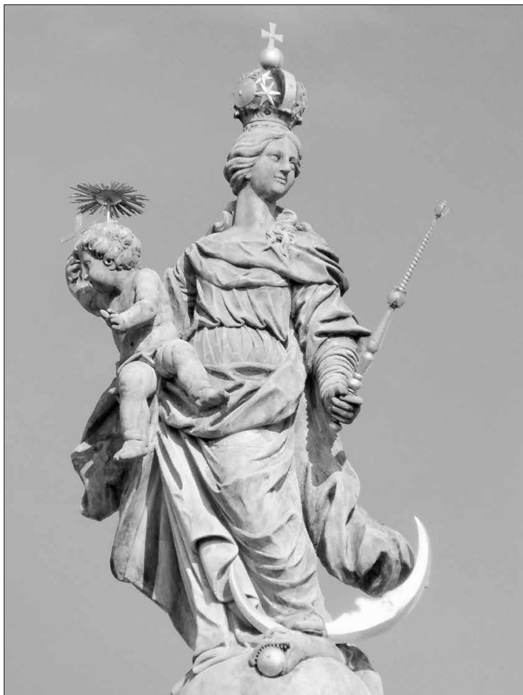
Mariánský morový sloup na Dolním náměstí v Olomouci

Maminka Markéta (28) Život matky Dona Boska Teresio Bosco - strana 12 -