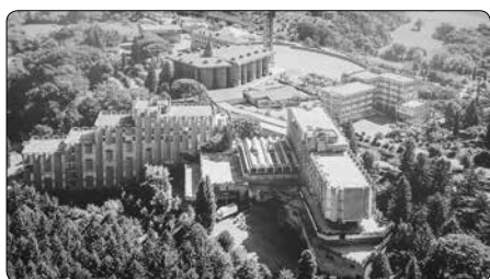
Exerciční dům v Collevaenza

M ezinárodní duchovní cvičení Mariánského kněžského hnutí probíhají už mnoho let vždy koncem června v exercičním středisku Collevaenza v diecézi Todí ve střední Itálii. V době covidových omezení, která byla v Itálii značně přísná, se toto každoroční setkání kněží omezilo na účast několika desítek italských kněží.