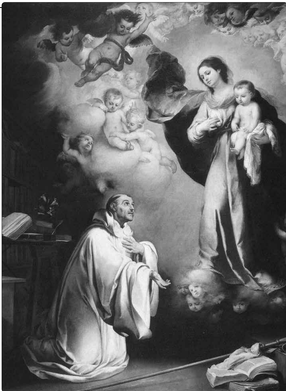
Bartolomé Esteban Murillo (1617-1682): Zjevení Panny Marie sv. Bernardovi

A byl přesvědčen: Tak jako se věčné Slovo stalo člověkem skrze Marii, tak to bude znovu ona, kdo způsobí zbožště-