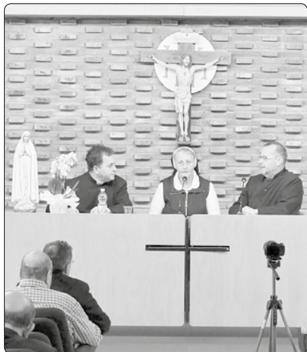
Svědectví při fraternitě

věřící k obrácení, modlitbě a postu, jakož i k hlásání evangelia. Vybavuje se mi také svědectví staříckého irského misionáře, působícího na Fidži v Oceánii. Než se dostavil na duchovní cvičení, navštívil svou rodnou vlast a příbuzné. Jedna z jeho příbuzných, řádová sestra, bydlící v jeho rodném městě Corku, má ve zvyku v centru města chodit často na mše svaté. Když tam ale našla pohozených 39 hostií, přestala je pak už počítat. Kněz si povzdechl: „ A to je moje milované katolické Irsko. To je důsledek podávání Eucharistie