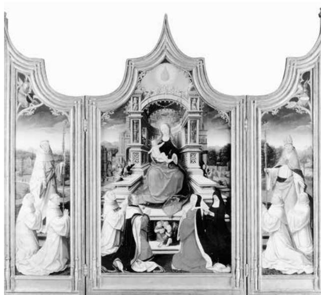
Jehan Bellegambe (asi 1470–asi 1536): Triptych z Le Cellier (Metropolitní muzeum umění v New Yorku)

„Vzápětí se chlapci ukázal právě narozený Ježíšek. To mělo vliv na posílení a růst jeho ještě dětsky křehké víry a bylo počátkem mystických milostí jeho rozjímavého života. Ježíšek se mu zjevil, jako by se znovu narodil z lůna přeblahoslavené Panny jako »Slovo beze slov«, sice jako dítě, ale přece svojí podobou krásnější nad všechny lidské děti.“