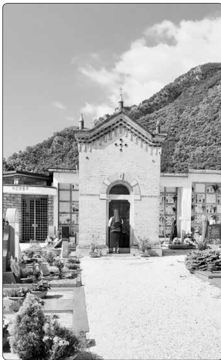
Hrobka kněží na hřbitově v Dongu