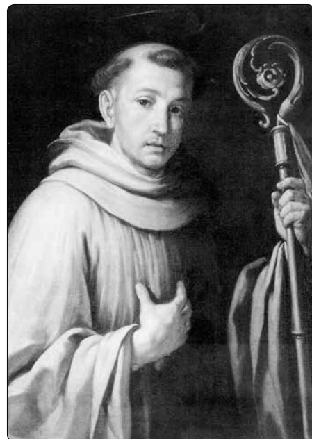
Antonio Palomino (1655–1726): Svatý Bernard

Tato víze se hluboce vryla do Bernardovy duše. Když později hovořil o vánočním tajemství, pokaždé jeho posluchači žasli nad teologickým bohatstvím a biblickým obsahem jeho kázání a přednášek.