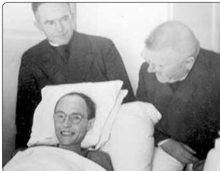
Blahoslavený Karel Leisner, sanatorium v Planegg

má právo na primici. Touha po kněžství spolu s přesvědčováním nakonec zvítězily, nicméně nešlo o tak jednoduchou záležitost, jak by se mohlo na první pohled zdát. Karel musel mít písemné povolení