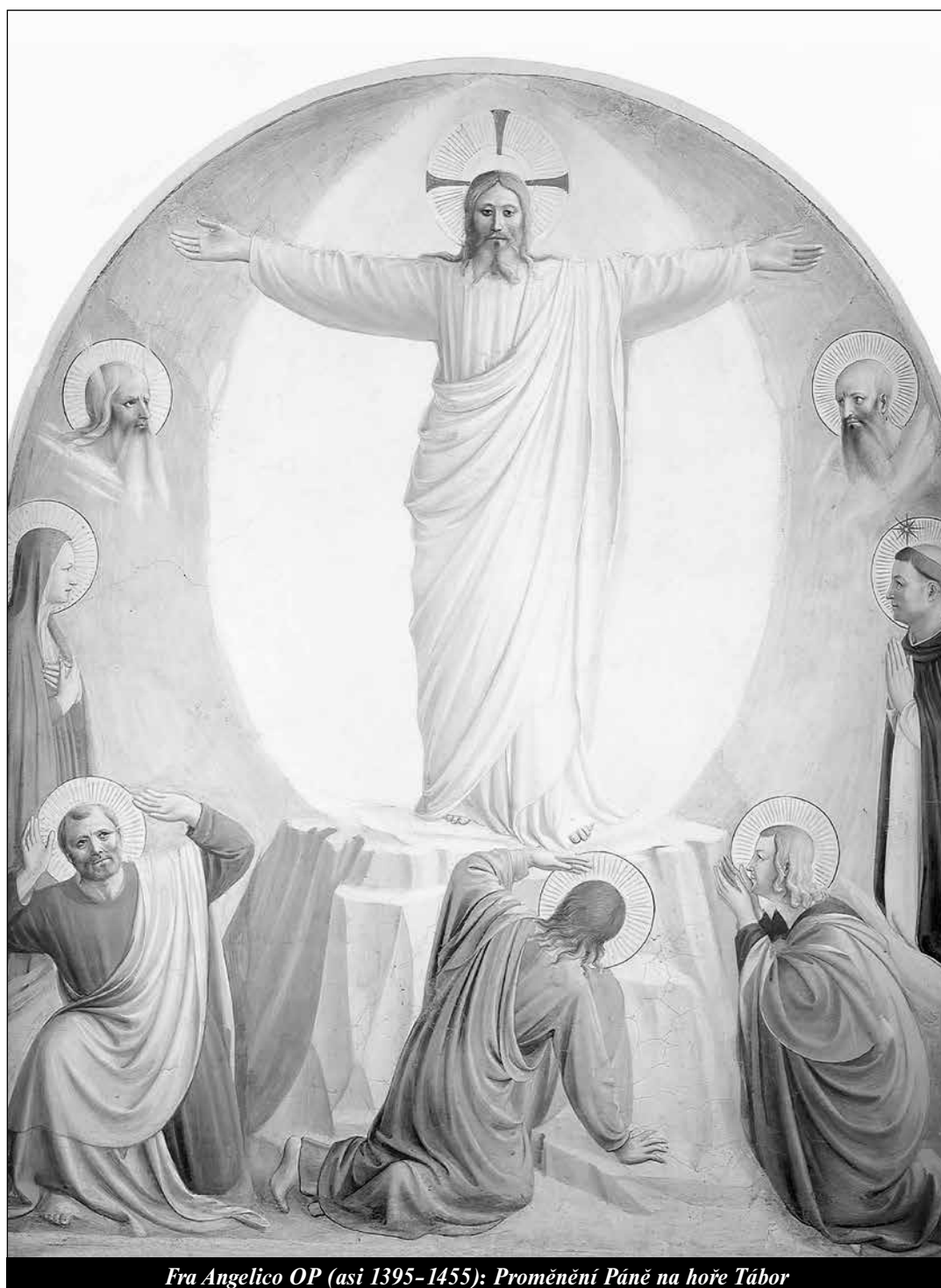
Fra Angelico OP (asi 1395-1455): Proměnění Páně na hoře Tábor