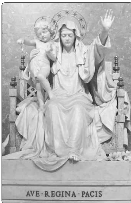
Socha Panny Marie, Královny míru, v bazilice Santa Maria Maggiore v Římě

Máme-li alespoň krátce probrat něco z toho, co Fatimu připravovalo, můžeme zde nejprve zmínit to, co zjevení Panny Marie předcházelo bezprostředně: Papež Benedikt XV. uprostřed první světové války, „Velké války“, která zabijela a ničila tolik a tolik lidí, měst a obcí, vícekrát usiloval o mír, ale jeho výzvam nebylo vládci tohoto světa – s výjimkou našeho císaře bl. Karla – nasloucháno. Takto odstrčen