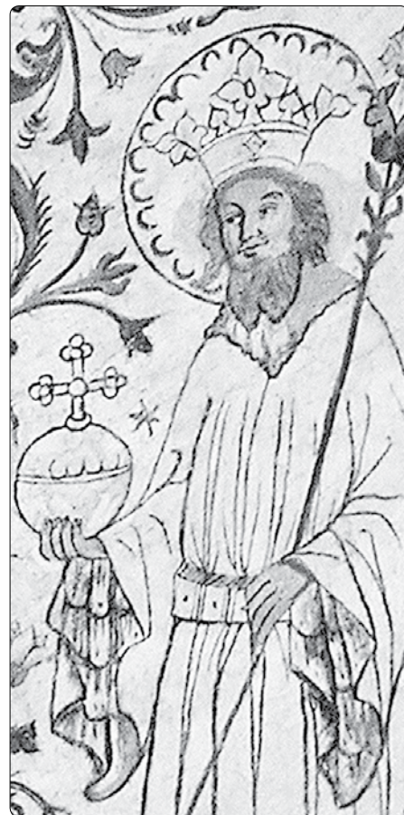
Svatý Erik IX. Jedvardsson na fresce z 15. století

Bylo tedy samozřejmostí, že na toto tažení vzal onoho roku 1154 s sebou i ctihodného biskupa sv. Jindřicha z Uppsaly,