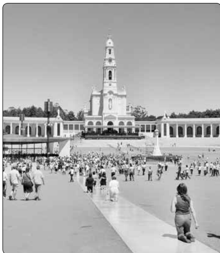
Fatima, bazilika Panny Marie Růžencové

drahé učitelky ve víře, jak by to měl připomínat i jeden starobylý kámen s latinským nápisem. (12) Její původní muslimské jméno se pak stalo jménem vesnice s mariánským kostelíkem, zatímco její křesťanské jméno dalo vzniknout jménu blízkého tamějšího města Vila Nova de Ourém.