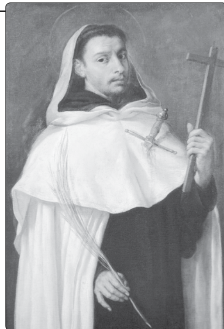
Antonio de Pereda y Salgado (1611-1678): Svatý Anděl Jeruzalémský

Na papežském dvoře nepobyl příliš dlouho, nicméně i tato krátká doba stačila, aby se po celém městě nesla od úst