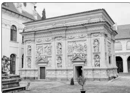
Loretánská kaple Panny Marie, součást Pražské Lorety

Slavný astronom Tycho de Brahe měl nedaleko odtud hvězdářskou pozorovatelnu a stěžoval si císaři Rudolfovi II., v jehož službách byl, že noční zvonění kapu-