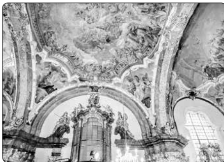
Interiér kostela Narození Páně

Sedmadvacet hrajících zvonků k poutnímu místu patří neodmyslitelně. Za