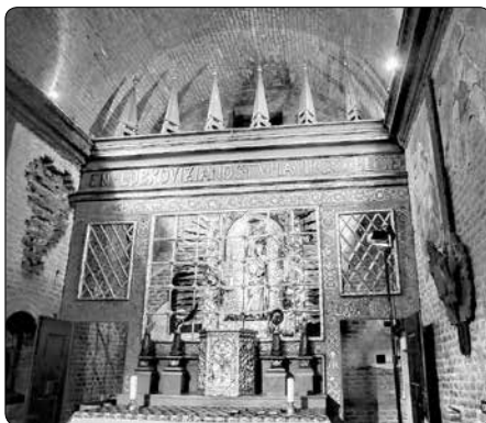
Interiér kaple Panny Marie

Rodina hlavní postavy příběhu žila v přepychu, jenže černá smrt, jak se nemocí říkalo, se nedržela pouze chudých,