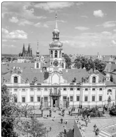
Výhled na Loretu z oken Černínského paláce

Historie kláštera sahá do roku 1600, přičemž je nutné zmínit velký požár ne-