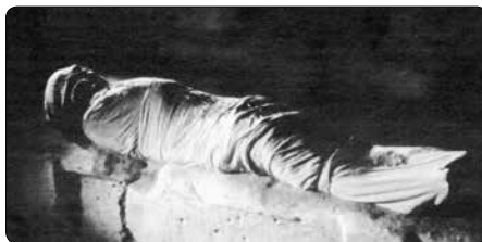
Kristovo tělo bylo zavinuto do plátna a uloženo do hrobu

Vědec Donald Lynn , člen skupiny STURP, který se podílí na programu zkoumání kosmického prostoru, takto psal o Turínském plátnu: „Máme před sebou neuvěřitelně přesné zpodobení, obraz umučení a smrti Krista. Věci skutečně závažnou je skutečnost tohoto obra-