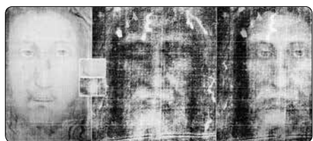
Na Turínském plátně a Roušce z Manoppella je vidět tvář téže osoby

Je ještě jiný předpoklad poukazující na skutečnost Kristova zmrtychvstání. Čteme jmenovitě v evangeliu sv. Jana, že Nikodém přinesl k pomazání Ježíšova tě-