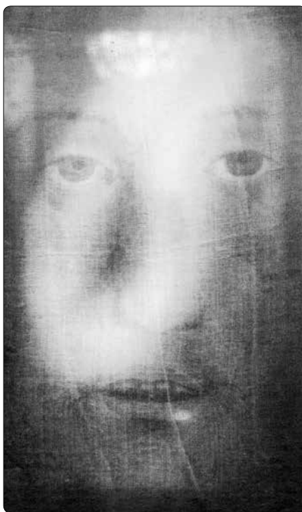
Tvář Krista na Roušce z Manoppella