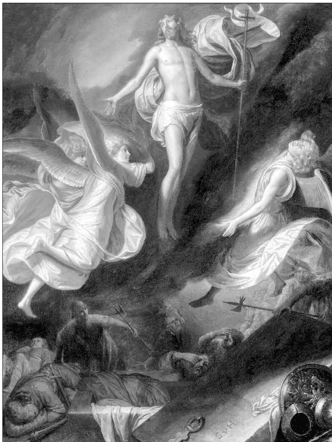
Samuel Dirksz van Hoogstraten (1627-1678): Vzkříšení Krista