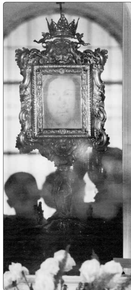
Na Roušce z Manoppella zůstal trvale otisk Tváře Krista zmrtychvstalého

Dalším udivujícím rysem Tváře z Manoppella je průzračnost plátna a fakt, že obraz je dokonale viditelný stejně z jedné, jako i z druhé strany – jakoby na diapositivu. Spolu s měnícím se osvětlením se mění obraz tak, jako by žil. Pokud se na něj hledí pod jasným světlem, obraz mizí. Svátá Tvář z Manoppella je udivujícím zobrazením, které bylo zachyceno na drahocenné antické tkanině. Jedná se o bys-