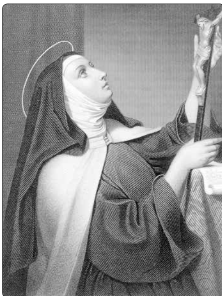
Svatá Terezie z Avily

brž najednou jen celou její postavu. Byla bíle oděna a obklopena velkým jasem, který neoslepoval oči, nýbrž působil velmi příjemně. Svatého Josefa jsem neviděla tak zřetelně; cítila jsem nicméně jeho přítomnost, jak tomu bývá u zjevení, která nejdou skrze smysly. Naše milá Paní mi připadala velice mladičká. Když se oba u mne krátký čas zdrželi a naplnili mě velkou radostí a blažeností, jakou jsem, myslím, nikdy předtím nepocítila a jakou bych si provždy přála, zdálo se mi, jako bych viděla, že se zvedají k nebesům, obklopeni velkým zástupem andělů.