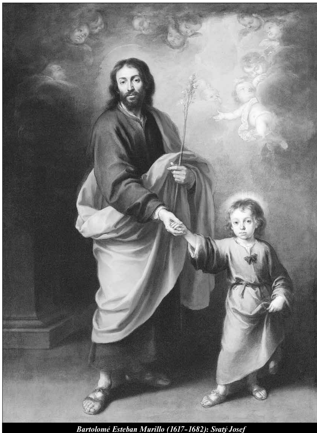
Bartolomé Esteban Murillo (1617-1682): Svatý Josef