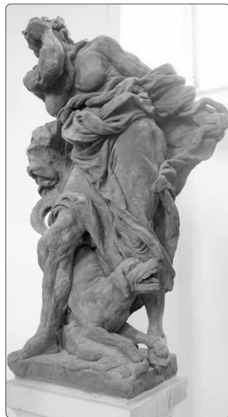
Matyáš Bernard Braun (1684–1738) Závist

Problémy závistivých lidí jako by ztráceli na intenzitě, když slyší o slabostech známých osobností. Čtenáři, kteří mají potěšení z novinových skandálů a pomluv,