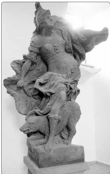
Matyáš Bernard Braun (1684–1738) Hněv

Druhým stupněm jsou návaly zlosti, při kterých se silně gestikuluje, krev se pěni a obličej mění barvu, někdy dojde i k házení předměty. To jsou všechno příznaky, že Ego nestrpí, když někdo brání splnění jeho sobeckých tužeb.