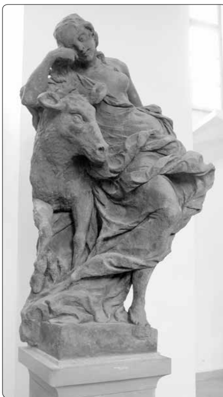
Matyáš Bernard Braun (1684–1738) Lenost

Jsou různé stupně lenosti: nedbalost, práce prováděná bez pečlivosti, pouhé