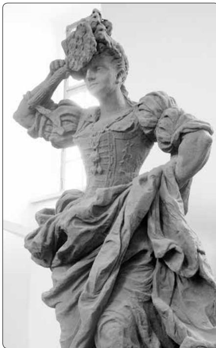
Matyáš Bernard Braun (1684–1738)

cionáře. Výmluv je habaděj. Všichni jsou na omylu, jen ne egoista. Přesto existuje paradoxní pravda, že egoista v podstatě sám sebe nenávidí. Jeho výstřelky v pití i v sexu, jeho útoky proti všem, kteří stojí v cestě jeho vlastní vůli, jeho dojem stále většího odstupů mezi snem a skutečností, to všechno vyvolává v jeho vědomí pochybnosti a cynismus a v podvědomí starosti a úzkosti. Falešná sebeláska plodí strašnou nenávist k sobě, snahu zničit své já, trestat se za to, že nic není dokonalé a že se neuskutečňuje ono velikášství vlastního Já, které se pokládá za neomylné a bohorovné.