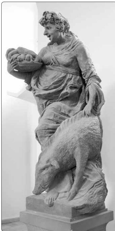
Matyáš Bernard Braun (1684–1738) Nestřídmost

Nečistota nemá s legitimním naplněním pohlavního života v pravém manželství nic společného. Pravá manželská láska vede k utváření my a k rozpuštění sebestřednosti. V manželské lásce hledá osoba dokonale rozvinutí ty, osobnosti, která stojí proti „já sám“. Není světlejšího okamžiku, než když se Ego zcela daruje druhé osobnosti, takže pud se zcela rozpouští v radosti, že můžeme bezmezně milovat druhého. Takto milující nejsou nikdy sami, proto k lásce patří nikoliv dva, nýbrž tři, a tím třetím v tomto svazku je Bůh. Jedno Ego miluje druhé