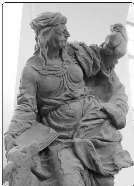
Matyáš Bernard Braun (1684–1738) Lakomství

Přehnaná láska k luxusu a komfortu je dalším znamením duchovní zaslepenosti. Čím méně má někdo opravdový charakter, tím více se stará o to, aby to zevně nahradil: kožesšinami, diamanty, šperky, jachtami; všemi těmito věcmi se pokouší obohatit své zchudlé Já. Člověk tak zaměňuje mít a být. Egoista si představuje, že je něco více, když má něco cenného. To je jediný hřích, kterým u druhých nejvíce pohrdáme, ale u sebe jsme na to nejvíce pyšní. Je to psychologicky ověřená zkušenost,