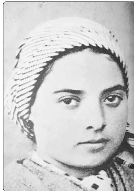
Sv. Bernadeta Soubirousová