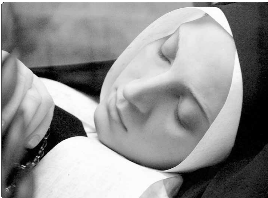
Sv. Bernadeta Soubirousová

V roce 1923 vyhlásil papež Pius XI. hr-dinské ctnosti Bernadety Soubirousové, a tím se otevřela cesta k její beatifikaci. Bylo nutné třetí a poslední zkoumání těla, které se uskutečnilo 18. dubna 1925, čili po 46 letech od Bernadetiny smrti. Tehdy byli přítomni: biskup z Nevers, policejní komisař, starosta města a lékařská komise. Po složení vyžadované přísahy byla přinesena rakev a otevřena v kapli sv. Heleny. K překvapení všech přítomných bylo Bernadetino tělo zachovalé v ideálním stavu! Na tomto místě můžeme citovat úryvek ze závěrečného posudku předsedy lékařské