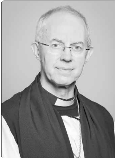
Justin Portal Welby (narozen 6. ledna 1956), biskup anglikánské církve, od roku 2013 slouží jako 105. arcibiskup z Canterbury

Zprvce bude zřízen nový investiční fond, který zajistí „lepší a spravedlivější budoucnost pro všechny, zejména pro komunitu postižené historickým otroctvím“.