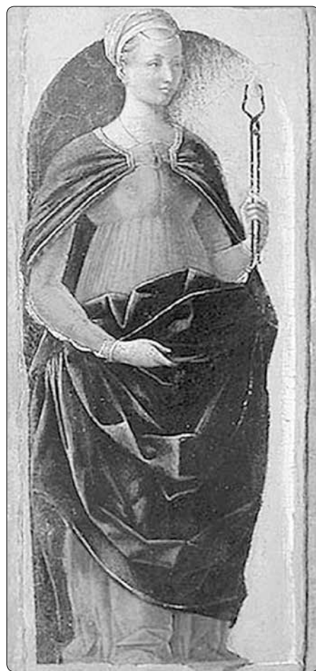
Ercole Ferrarese (1451–1496): Sv. Apolonie

Apolonie to ale rezolutně odmítla. Její vězňatelé však neměli pro její heroismus pochopení a použili ke svému přesvědčování hodně hrubou sílu: surovým bitím jí vyrazili všechny zuby a přerazili obě čelisti (jiná verze hovoří o vytrhání zubů kleštěmi). Ani tehdy však nepovolila. Proto tuto ve víře pevnou ženu přivedli k hořící hranici a dali jí poslední šanci zachránit si život. Není snad ani třeba dodávat, za jakou cenu. Pokud by neposlechla, skončí v plamenech, ujistili ji.