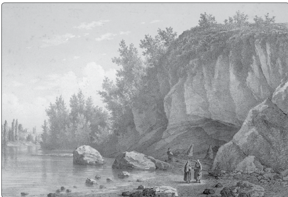
Jeskyně Massabielle v Lurdách kolem roku 1860

Budeš-li někdy na pouti v Nevers, pamatuj, že ve skleněném sarkofágu se nachází zázračně uchované, procesem