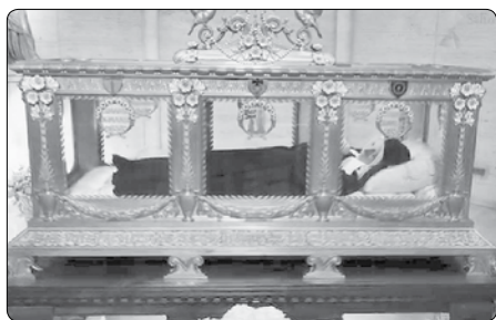
Sarkofág s tělem sv. Bernadety v Nevers

Pro relikvii byly odňaty kousky jater, sval a dvě žebra. Bernadetino tělo zůstalo v kapli sv. Heleny, která byla zapečetěna do doby beatifikace, uskutečněné