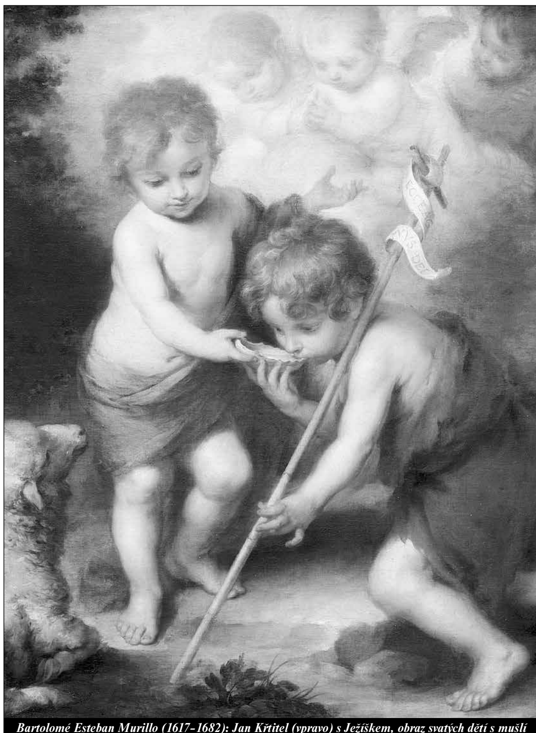
Bartolomé Esteban Murillo (1617-1682): Jan Křtítel (vpravo) s Ježíškem, obraz svatých dětí s mušlí