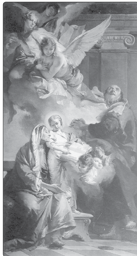
Giovanni Battista Tiepolo (1696–1770): Vzdělávání Panny Marie

Z tohoto hlediska v církvi nikdy nevymizela idea, že v Marii je možno rozpoznat církve, že celá církve je ustavena mariánsky a dělá plně jen to, co Maria sama učinila. Tak je možno vztáhnout místo z 12. kapitoly Zjevení na Marii. Na přelomu 8. a 9. století říká k tomu Alkuin z Yorku ve svém komentáři k Apokalypse: „Žena oděná sluncem je blahoslavená Panna Maria. Ale v ní poznáváme celý lidský rod – a tím je církve. Neboť ona je nazývána ženou nikoliv pro slabost svého pohlaví, nýbrž proto, že denně plodí nové národy, z nichž je budováno obecné Kristovo Tělo.“