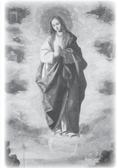
Francisco de Zurbarán (1598-1664): Neposkvrněné Početí

Neposkvrněná a nejsvětější Panno, nejčistší Matko, která jsi působením Ducha Svatého porodila Syna věčného Otce, věčný chrám božské Trojice, bud' pozdravena. Ty jsi požehnaná mezi všemi ženami, Bůh tě učinil tou nejblaženější, protože skrze tebe naplnil celou zemi svou vznešeností a majestátem. Svatá Panno, ty jsi vzešla světu jako jasné červánky, které nám přinesly Slunce vznešenosti. Skrze tebe byla zaplácena strašlivá noc temnoty, zlomena moc tyranů, zničena smrt, poraženo peklo, zrušeno nepřátelství mezi Bohem a člověkem, zajištěn mír, uzdraveny nemoci duše milostí svatosti a celý svět zazářil nejjasnějším světlem pravdy. Bud' pozdravena, Panno Maria!