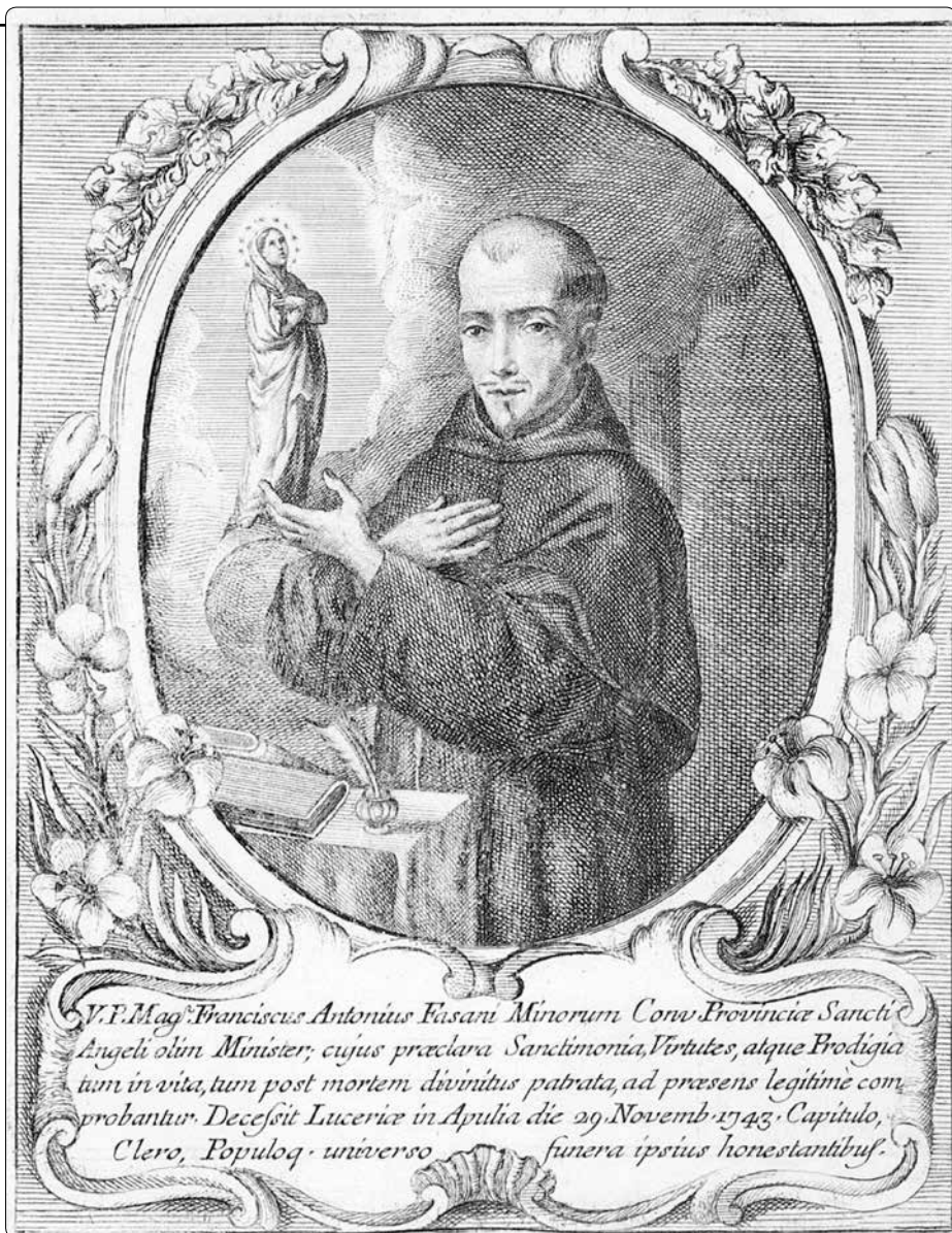
Svatý František Antonín Fasani

Pannu Marii kladl svým posluchačům často za nejzářivější vzor čistého života. „Po celý svůj život byla nejspřádanějším bytím, v němž se přirozenost a milost staly obdivuhodnou harmonií a duch i tělo, stejně jako síly vyšší a nižší, byly v dokonalém souzvuku s prvotní spravedlností. Ty ses naopak ve svém životě poskvrnil mnoha hříchy. Kolik nedbalosti v zachovávaní Božího zákona, kolik přestoupených přikázání, kolik zanedbaných povinností... Pohled, jak tvrdý zápas se odehrává v tvém nitru, jak smysly odporují rozumu a tělo duchu. Kolikrát jsi Boží dar vrátil bez užitku. Tak dlouho ti Pán opakuje, jak vřele touží po tvé spáse, a ty mu protiřečíš svými choutkami, odmítáš jeho vnuknutí, odporuješ jeho milosti. Pakliže tyto jeho výzvy neposloucháš, nejdeš vstříc nejvyšším cílům Prozřetelnosti. Všechno to vyvěrá ze zanedbání ducha modlitby. I po té náboženské stránce, když se o Bohu učí, když se o Bohu káže, když se na Boha ukazuje, když se o Bohu diskutuje, když se čtou evangelia a teologické spisy o Bohu, přesto zůstává duch prázdný a bez