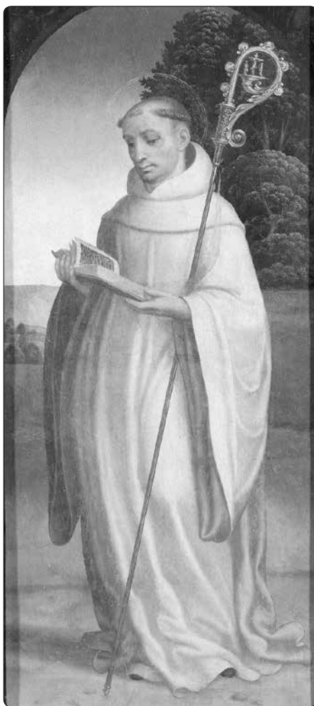
Juan Correa de Vivar (asi 1510–1566): Sv. Bernard z Clairvaux

Co pak učinil Syn, když viděl, že Bůh Otec je tolik horlivý pro jeho slávu a pro něho neušetril stvořené anděly? „Hle,“ řekl, „kvůli mně můj Otec potrestal své stvoření, prvního z andělů, který chtěl můj trůn a který měl i své následovníky, kteří mu uvěřili, avšak vzápětí horlivost mého Otce mu hrozným trestem splatila. A člověk chtěl rovněž přivlastnit si ode mě poznání, které