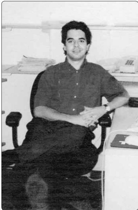
Více než 12 let jsem žil tak, jako by Bůh neexistoval...

Měl jsem šťastné dětství. Bavilo mě hrát s kamarády fotbal. Při zkouškách jsem měl ze všech předmětů nejlepší