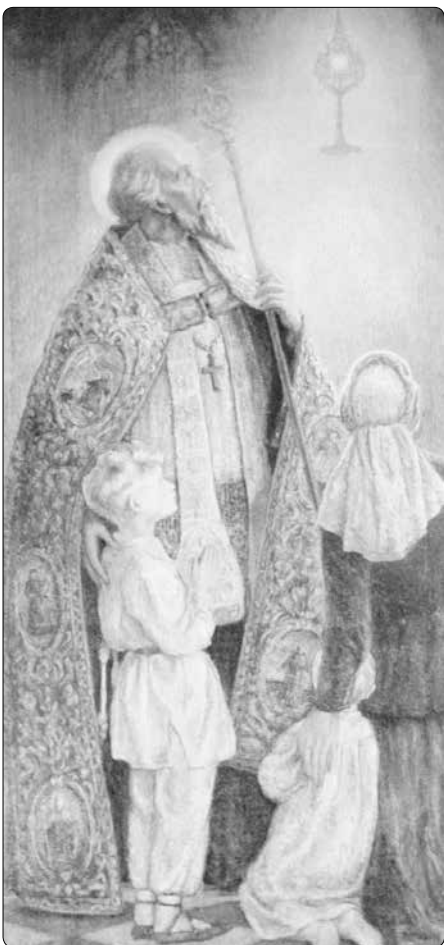
Blahoslavený Jakub Strzemie

Podle některých zdrojů studoval v Římě a po návratu se patrně stal představeným minoritského konventu v Krakově. Později se dostal do lvovského kláštera sv. Kříže, kde mezi lety 1385–1388 působil v postavení kvardiána. Ze své po-