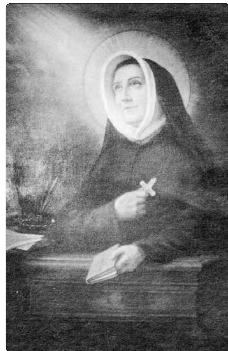
Sv. Magdalena Sofie Baratová

Ponechávej mimo sebe všechno, co může stvořit hřích. (...) Čti dobrou literaturu, nejenom náboženskou. Filosofie k ničemu nevede. (...) Zbavuj se vad: jazyka rozumování, neužitečné chvály, lenivosti ducha, lhostejnosti a vnučování některých vlastních názorů bližním. Ničeho se neboj, kromě hříchu. Udržuj duši v radosti a tichu. Miluj, a láskou prozařuj každou práci. (...) Nejprospěšnějším umrtvováním je dobrovolné a systematické zbavování se vlastních chyb. Bohu je nejmilejší člověk čistý a radostný, který přináší pokoj a slunečné ticho do duší bližních.“