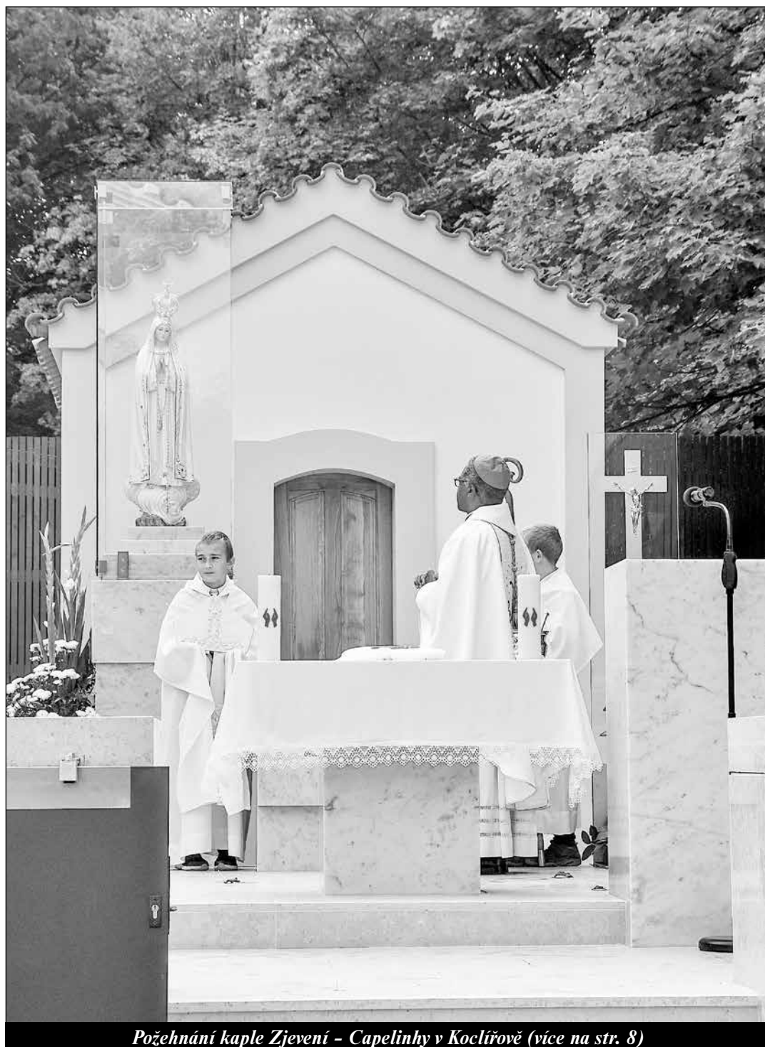
Požehnání kaple Zjevení - Capelinhy v Kocliřově (více na str. 8)

Vatikán: Svět bez jaderných zbraní je nutný a možný - strana 13 -