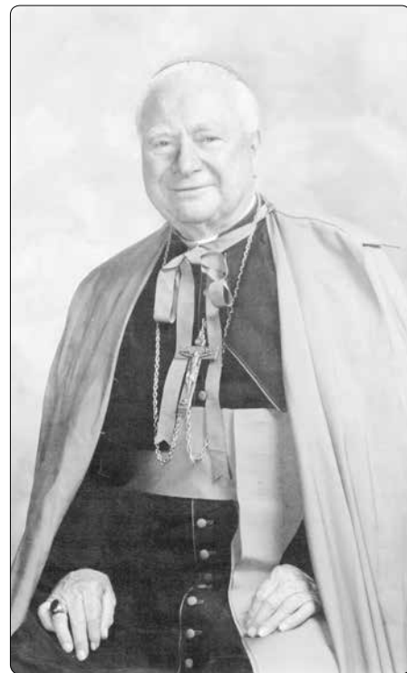
Biskup Kennedy byl Boží muž, který se často usmíval, a proto ho nazývali „usměvavý biskup“

A tak jsem tam stál před dítětem, které nikdy nepromluvílo, neslyšelo jediný zvuk, nevidělo žádný předmět, které vlastní silou neumělo ani chodit, a zeptal jsem se sám sebe: „Jaký to má celé smysl?“ A najednou mě napadlo: „Tady je děvče, které nikdy nespáchalo hřích očima, jazykem ani ušima; které nikdy nevstoupilo na místo, kde by mohlo spáchat hřích. Toto děvče bylo svaté, bylo světlejší než já, protože já jsem zneužíval dar zraku tím, že jsem se díval na neslušné věci, které mě podněcovaly k nečistotě. Bylo světlejší než já, protože jsem používal jazyk k rouhání, lži a k jiným přestupkům, jichž se dopouštíme jazykem. Slyšel jsem věci, které mohly ublížit jiným, které byly zraňující a nevhodné. V mém životě se bezpochyby naskytlo mnoho příležitostí, kterých ještě dnes lituji, že jsem měl sílu jít na místa, na nichž bych teď raději nikdy nebyl.“