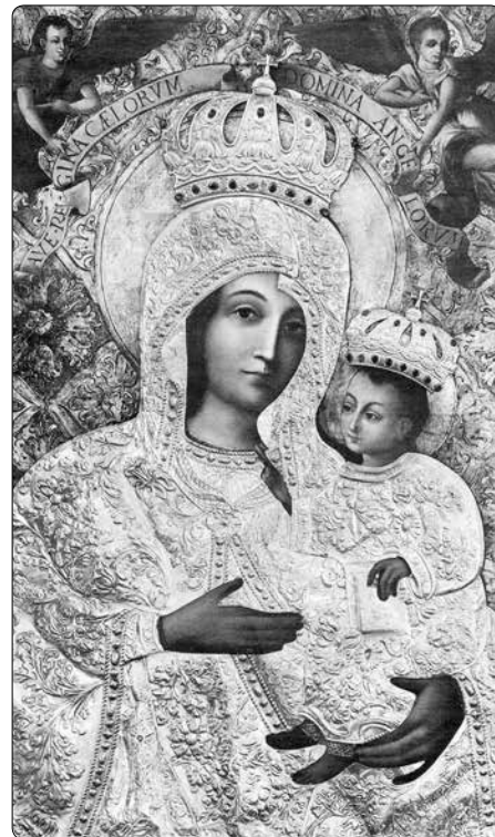
Obraz Matky Boží Gietrzwaldské