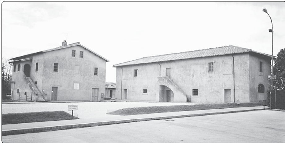
Dům (vpravo), kde byla zabita Marie Goretti