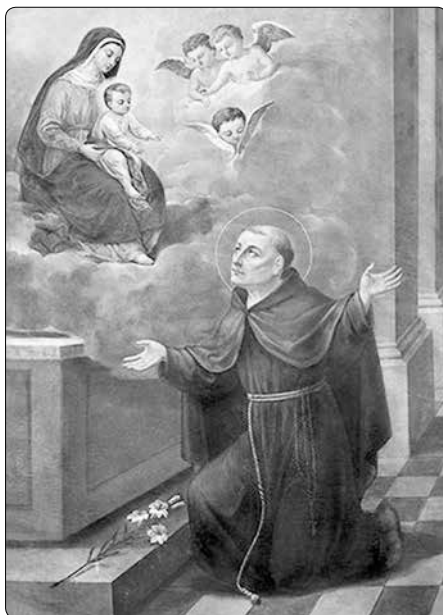
Sv. Jan z Dukly

Rovněž v novém domově byl Jan pověřen kazatelskou činností. Věnoval se jí nejprve v Poznani a poté opět ve Lvově. Na každé kázání se připravoval dlouhé hodiny na kolenou, v této poloze konec konců trávil značnou část svého života. Zároveň vypomáhal v knihovně, na zahradě (zřídil