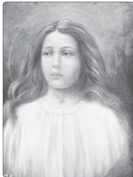
Sv. Marie Goretti