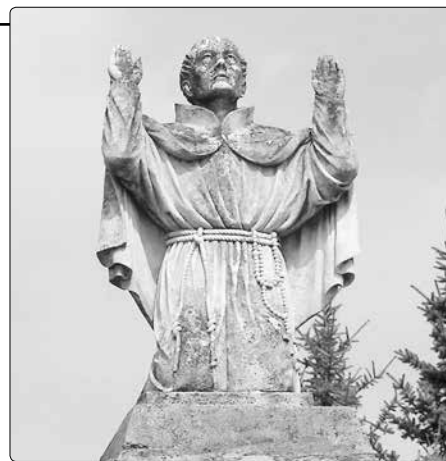
Socha sv. Jana z Dukly na Dukle před kostelem otců bernardinů

si na ní dokonce malou poustevnu) a v kuchyni. Přímo vzorně celý čas plnil své povinnosti vyvěrající z konstitucí, vynikal horlivostí a láskou k Panně Marii. Poctivě a obětavě navštěvoval nemocné a zpovídal, a to i v době, kdy byl vážně nemocný.