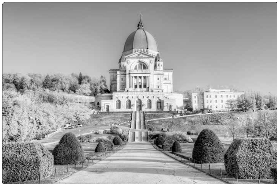
Bazilika sv. Josefa v Montrealu

Z Vítězstvo Srdca 139/2021 přeložil a upravil -dd-