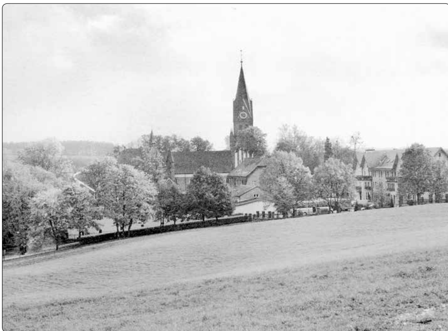
Pohled na chrám Matky Boží v Gietrzwaldu