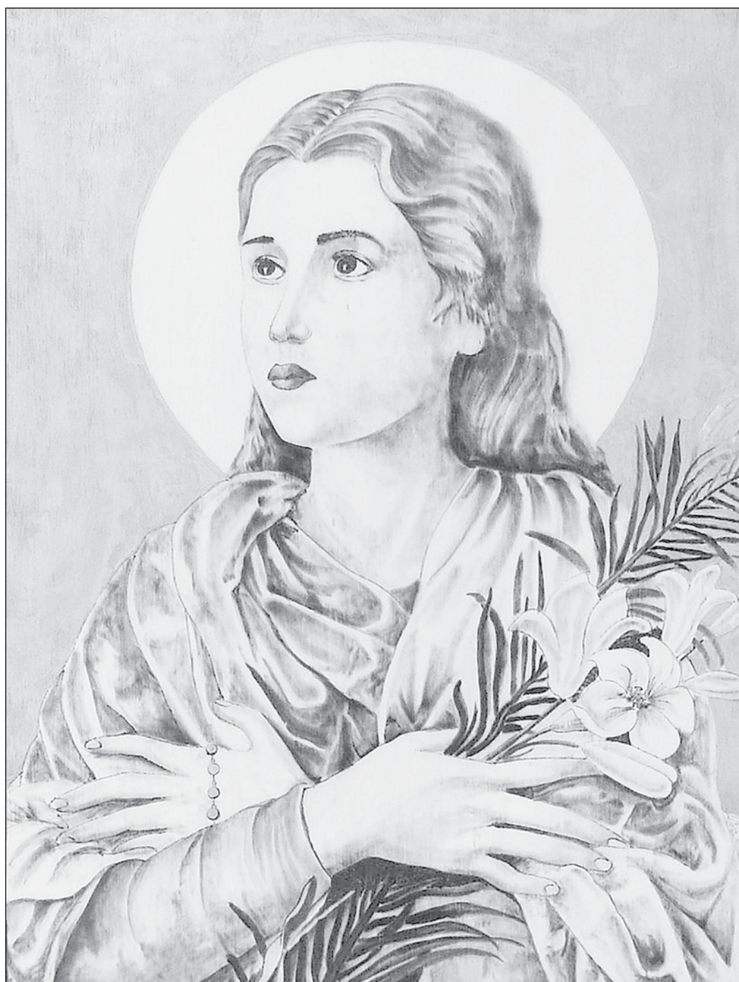
Sv. Marie Goretti (16. 10. 1890 - 6. 7. 1902)

Nebe nad močály (1) Četba na pokračování - strana 11 -