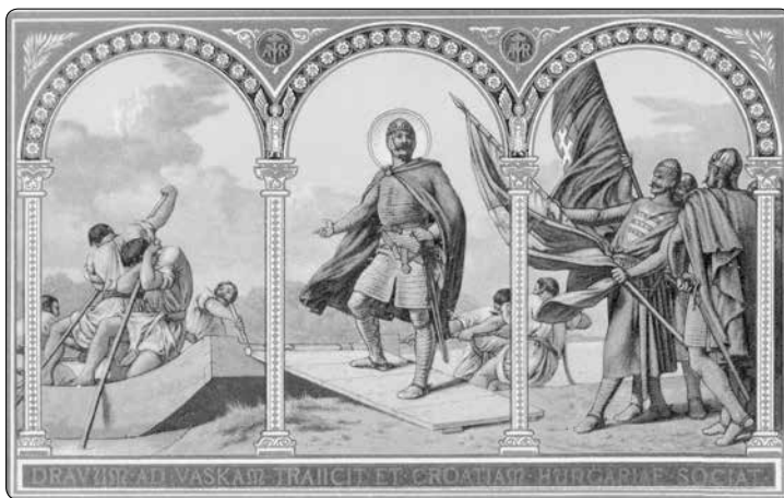
Uherský král svatý Ladislav překročí řeku Drávu, aby dobyl Chorvatsko (obraz Bertalana Székelyho, 19. století)

V roce 1556 Ladislavův hrob zprofanovaly protestantské oddíly Jana Zápolského. Pouze část z těchto relikvií přečkala v Ostrihomi, kde jsou dodnes, a také v Györu. Počestěnou podobu jeho jména - Vladislav - dávali svým synům čeští Přemyslovci a jeho kult byl velmi populární i v Polsku. Ladislavovým jménem byl např. pokřtěn litevský vládce Jagello a nosilo ho několik synů královské krve.