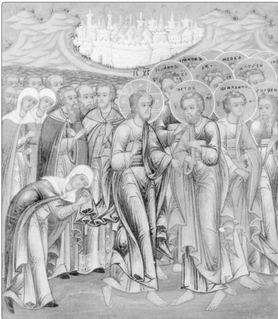
Uzdravení ženy trpící krvotokem, ruská ikona z 19. století

Rovněž svatá Faustyna Kowalská mohla svým způsobem zažít, co se událo ve večeřadle: „Nejhlouběji jsem byla ale dojata ve chvíli, v níž Ježíš před konsekrací pozdvihl oči k nebi a započal tajemný rozhovor se svým Otcem. Tu chvíli patřičně poznáme teprve na věčnosti. Jeho oči byly jako dva plameny, obličej rozzářený, bílý jako sníh, celý majestátný, jeho duše vyprahlá, ve chvíli konsekrace si odpočinula ukojená láska – oběť je plně