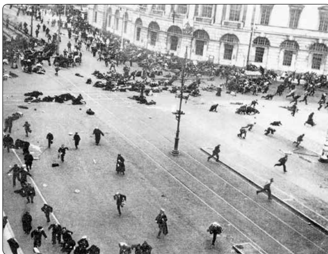
Fotografie zhotovená po zahájení palby vojskem při manifestaci na Něvském prospektu v Petrohradě 4. července 1917

že silné vlny revoluce v Rusku i na Západě nelitostně smetou kontrarevoluční snílky na okupovaných územích. (...) Nemáme důvod nevěřit, že kontrarevoluční bariéra mezi revolučním Západem a socialistickým Ruskem bude nakonec smetena.“ Autor nenechával žádné iluze v tom, že vzpomenuť „kontrarevoluční bariéra“, to je obrozující se polský stát, spolu s dalšími státy střední Evropy, umístěnými Stalinem do kategorie „obsazených (ruských) území“.