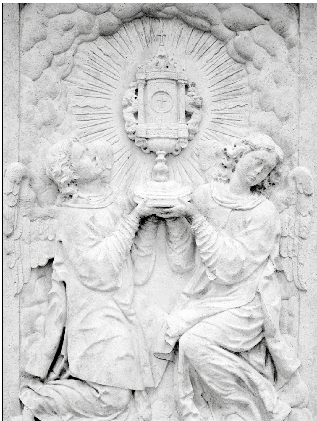
Reliéf zobrazující dva anděly s monstrancí na patě sloupu Panny Marie, Bratislava