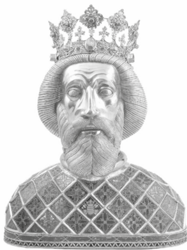
Relikviář uherského krále svatého Ladislava I. (asi 1040–1095)

Získal ji s vydatnou pomocí našeho knížete Vratislava II. a hlavně německého císaře Jindřicha IV. Zprvu byl Šalamoun zadobře se starším z Bělových synů – Gejzou, jenž mu pomohl vybojovat slavná vítězství nad Pečeněhy a Byzantinci. Bylo ale jen otázkou času, kdy se rozhoří spor mezi nimi, a příležitost na sebe nenechala dlouho čekat.