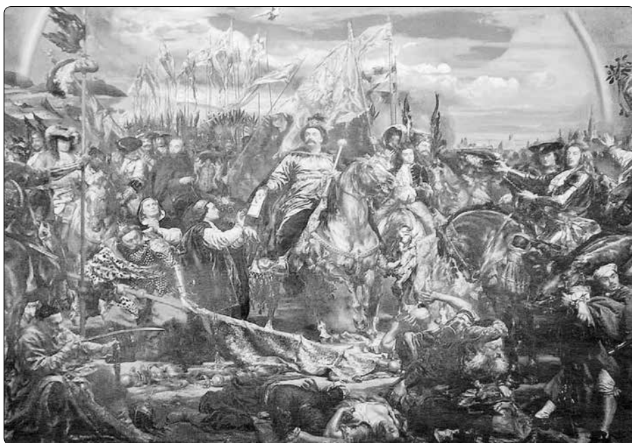
Jan Matejko - Jan III. Sobieski posílá zprávu o vítězství papeži Inocenci XI. po bitvě u Vídně

Po téměř 10 letech Engels zpřecizoval vizi onoho „slovanského barbarství“, ačkoliv mezi Slovy ne každý byl barba-