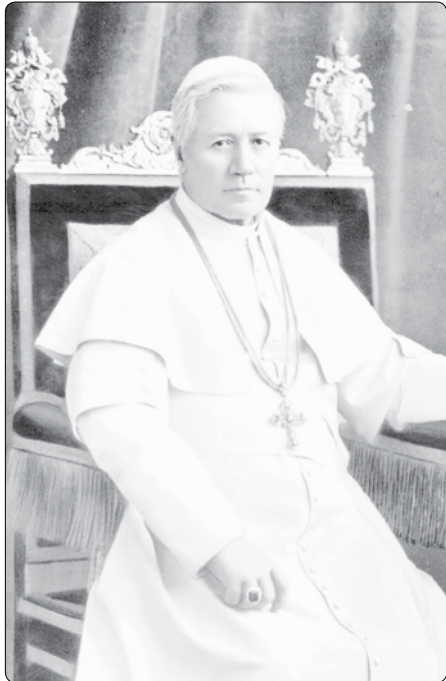
Sv. Pius X.

Č asté svaté přijímání věřících a zvláště dětí bylo pro Josefa Sarta – prostého venkovského faráře v severní Itálii, později biskupa v Mantově a poté patriarchy v Benátkách – naléhavým úmyslem, který mu ležel na srdci a stal se hlavní myšlenkou jeho působení, srdeční záležitostí, kterou se ještě účinněji snažil prosadit po zvolení na Petrův stolec v roce 1903. Roku 1905 svolal Pius X. do Věčného města První eucharistický světový kongres a jako „papež Eucharistie“, jak ho později lidé