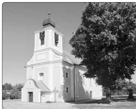
Kostel sv. Barbory v obci Pyšel

Ve Francii, konkrétně v Paříži také byla vyrobena a Pyšelu ji daroval zdejší rodák, kvadrián kapucínů z Gmundenu,