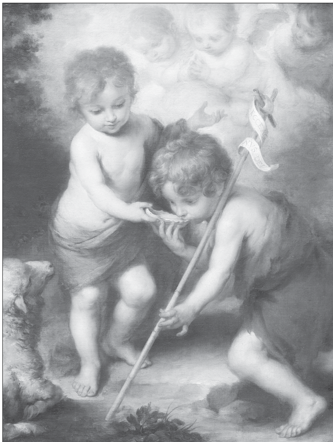
Bartolomé Esteban Murillo (1617-1682): Jan Křtitel (vpravo) s dítětem Ježíšem