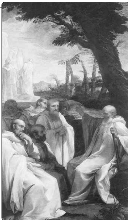
Andrea Sacchi (1599-1661): Vidění svatého Romualda, olej na plátně, 310 x 175 cm

Romuald se nenechal dvakrát pobízet a postavil tam spolu s nimi malý kostelík a kolem něj pár skrovných dřevěných chatrčí. Celé prostranství nazval Camaldoli (Campo di Maldoli). Tím dal počátek kamaldulskému řádu, což je větev řádu benediktinů vyznačující se velmi přísnými regulemi. Mniši žijí spolu, ale v mlče-