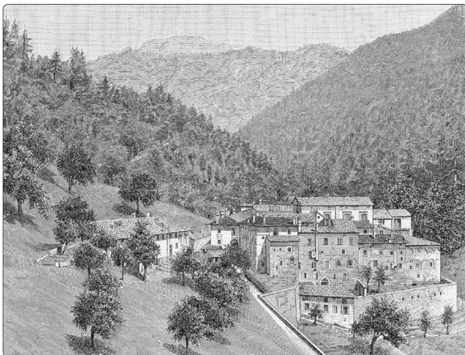
Klášteř Camaldoli, rytina z roku 1898. Svatá poustevna a klášter Camaldoli se nacházejí ve starobylém lese v toskánských Apeninách. V klášteře je uvítací místnost, velký sál a lékárna, která byla původně laboratoř, kde mniši studovali a pracovali s léčivými bylinami. Z důvodu stále rostoucího počtu poutníků zde byl postaven barokní kostel, v němž najdeme díla Giorgia Vasariho. O několik kilometrů dále stojí „Posvátná poustevna“ (Sacro Eremo), což je nejstarší část nadace. Byla osobně založena sv. Romualdem a sloužila jako srdce komunity i řádu.

Jaký rozdíl oproti komunitě mnichů z kláštera sv. Apolináře v Classe, kde se stal na výslovné přání císaře Oty III., zdůrazněně jemu osobně, opatem! Tamnímu osazenstvu se opět nezamlouvaly Romu-