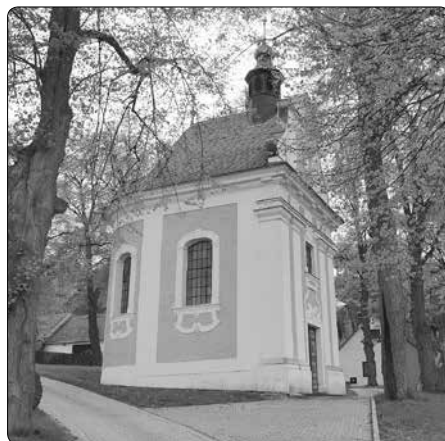
Dobrá Voda u Kdousova

Rodina šlechtice rovněž zařídila postavení malé kapličky, a to na místě, kde byla Panna Maria spatřena. Její sošku umístili do této stavby. Zvěst o události se velmi rychle rozšířila a přicházeli sem pout-