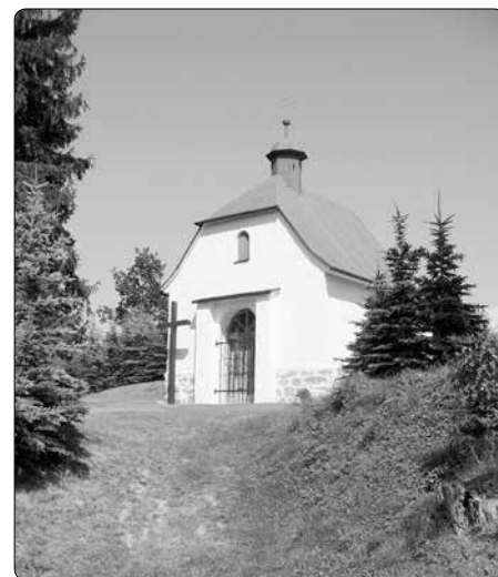
Kaplička Na Stráži zasvěcená Panně Marii Lurdské