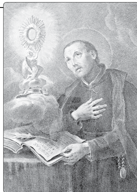
Svatý František Caracciolo

žen a poskytnutého noclehu od dobrých lidí. V duchu svého slibu dvakrát odmítl přijmout nabízený biskupský úřad, jímž ho zamýšlel obdařit sám papež Pavel V. Sedm let takto vedl mladou řeholní rodinu při jejich stále ještě prvních krůčcích klikatými a neschůdnými cestami vezdejšího světa a s nasazením připravoval na odchod na onen svět vězně před popravou a umírající ubožáky ve špitálech. Poté na vlastní žádost na toto poslání rezignoval, aby se mohl věnovat výhradně modlitbě a rozjímání. Svátý otec jeho žádosti vyhověl. František zůstával činný aspoň jako novicmistr a představený jednoho z klášterů.