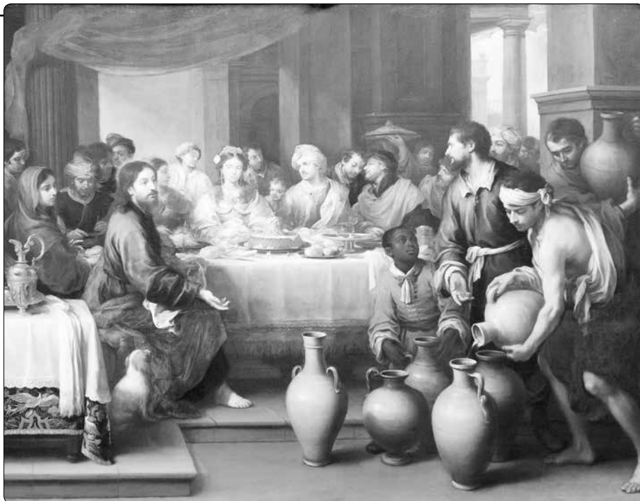
Bartolomé Esteban Murillo (1617–1682): Svatební hostina v Káně

Jako následek prvního hříchu, jímž se člověk zcela odvrátil od Boží lásky, byla zničena i jednota těla, ducha a duše. Sexualita, která měla být nejintimnějším výrazem výlučné lásky mezi mužem a ženou, se vyčlenila a v mnoha případech zdegradovala v něco zvířecího a pudového. Papež Benedikt XVI. o tom píše ve své encyklice Deus caritas est , když vzpomíná nábožen-