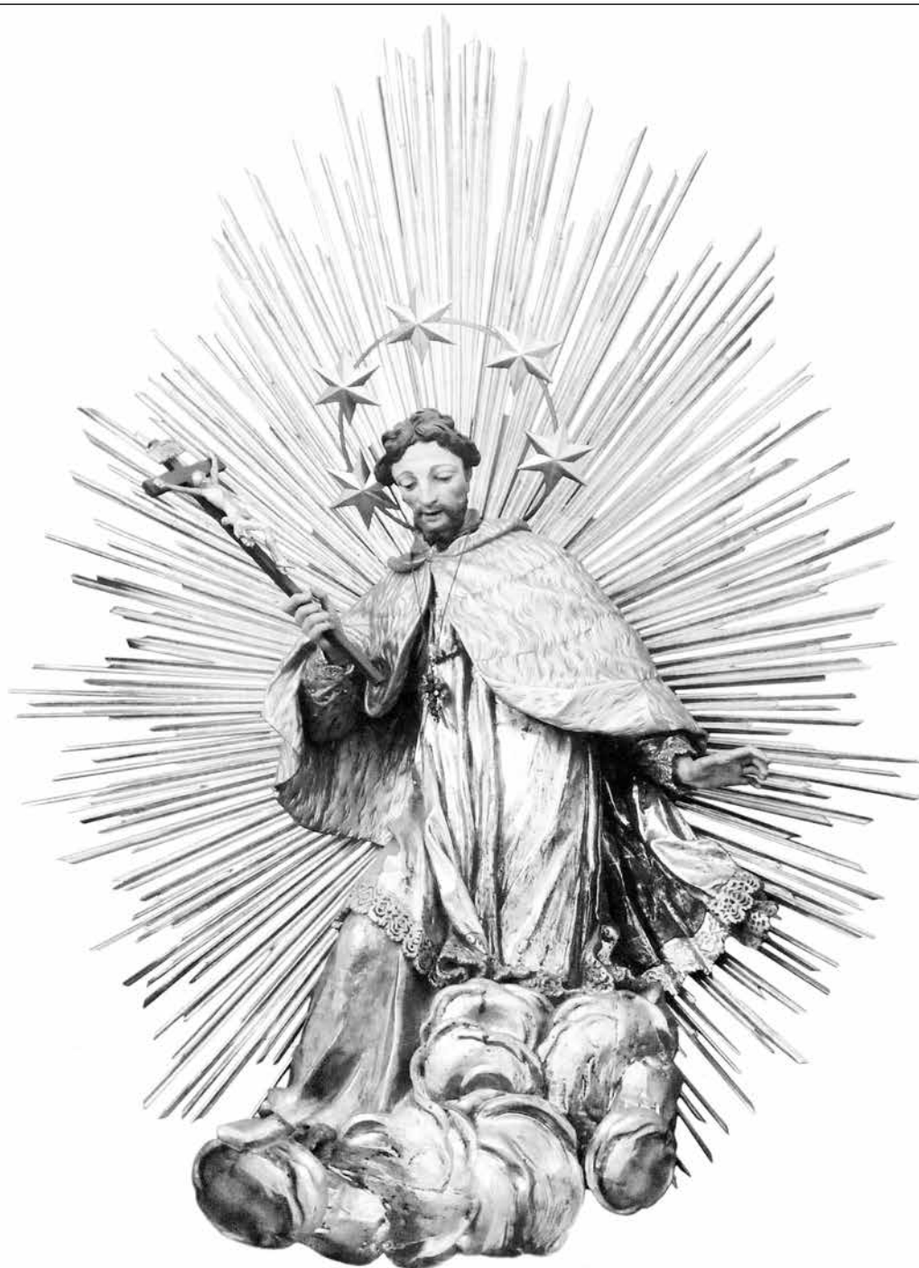
Socha sv. Jana Nepomuckého v kostele sv. Jana v Innsbrucku