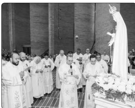
Mezinárodní duchovní cvičení v italské svatyni Collevaenza v r. 2019

„Dnes chci znovu po všech zasvěcení mému Neposkvrněnému Srdci. Žádám je především od papeže Jana Pavla II., prvního přemilého syna, který je slavnostním způsobem provádí u příležitosti tohoto svátku, potom co napsal všem biskupům světa, aby je vykonali v jednotě s ním. Bohužel ne všichni biskupové přijali tuto výzvu! Zvláštní okolnosti ještě nedovolily, aby se mi zasvětilo výslovně Rusko, jak jsem to vícekrát žádala.