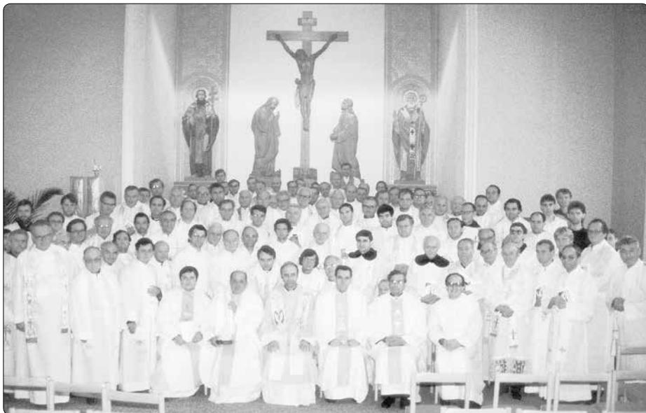
Duchovní cvičení formou večeradla MKH v olomouckém semináři v r. 1991

„Nemarněte čas u televize, která je nejsilnějším nástrojem v ruce mého Protivníka, jíž šíří všude temnoty hříchu a nečistoty. Televize je bůžek, o němž se mluví v Apokalypse, vytvořený k tomu, aby se mu klaněly všechny národy země, jemuž Ďábel dá-