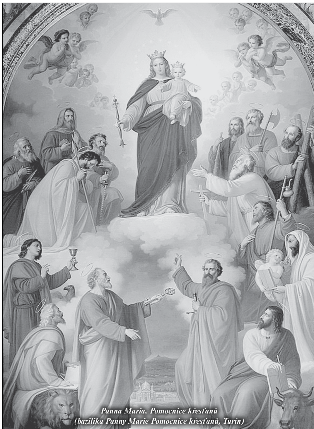
Panna Maria, Pomocnice křesťanů (bazilika Panny Marie Pomocnice křesťanů, Turín)

ThDr. František Tomášek: Katechismus katolického náboženství - strana 12 -