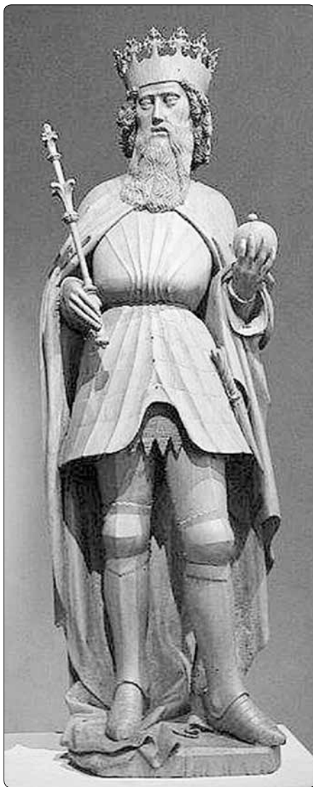
Socha sv. Zikmunda z roku 1443. Nyní je uložena v Bavorském národním muzeu.

Po otcově skonu v roce 516 převzal Zikmund vládu nad celým Burgundskem.