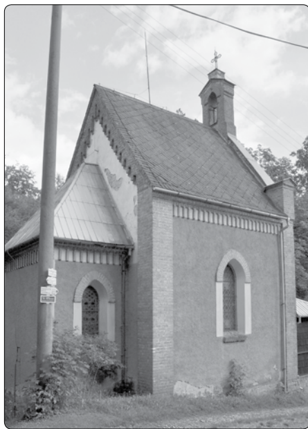
Poutní kaple Panny Marie Lasalettské v Travné. Kaple je součástí souboru staveb poutního místa, který byl v roce 2003 prohlášen kulturní památkou ČR.