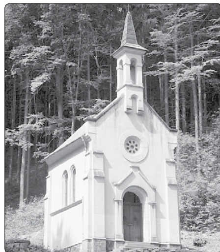
Poutní kaple sv. Antonína Paduánského v Rychlebských horách na Javornicku

Ovšem pro poutníky je daleko důležitější odlehlá kaple sv. Antonína Paduánského. Byla postavena v letech 1893–1894 na místě svých dvou předchůdkyň. K té úplně původní se vztahují dva příběhy.