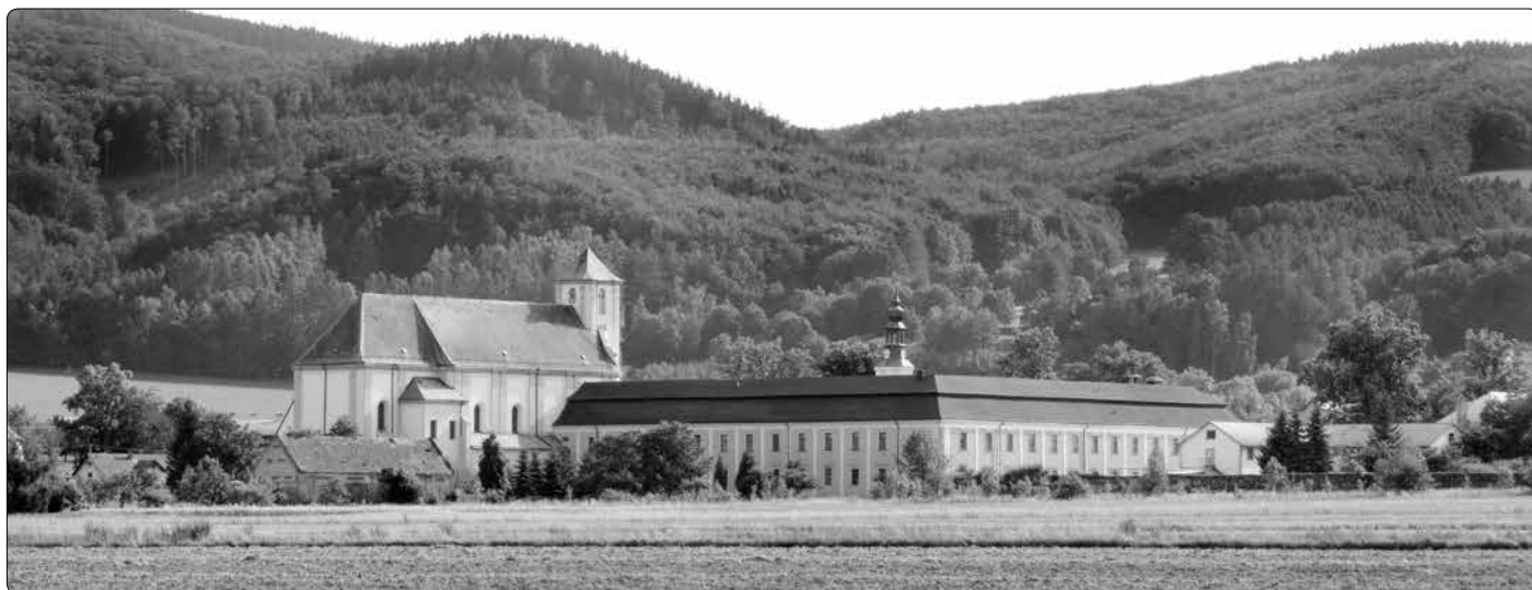
Bývalá piaristická kolej a kostel Navštívení Panny Marie v Bílé Vodě

Po obnovení kaple do Bílé Vody opět mířili věřící. Společně tak psali další historii a dospěli k době, kdy Bílou Vodu zdědili Lichtenštejnové-Kastelkornové.