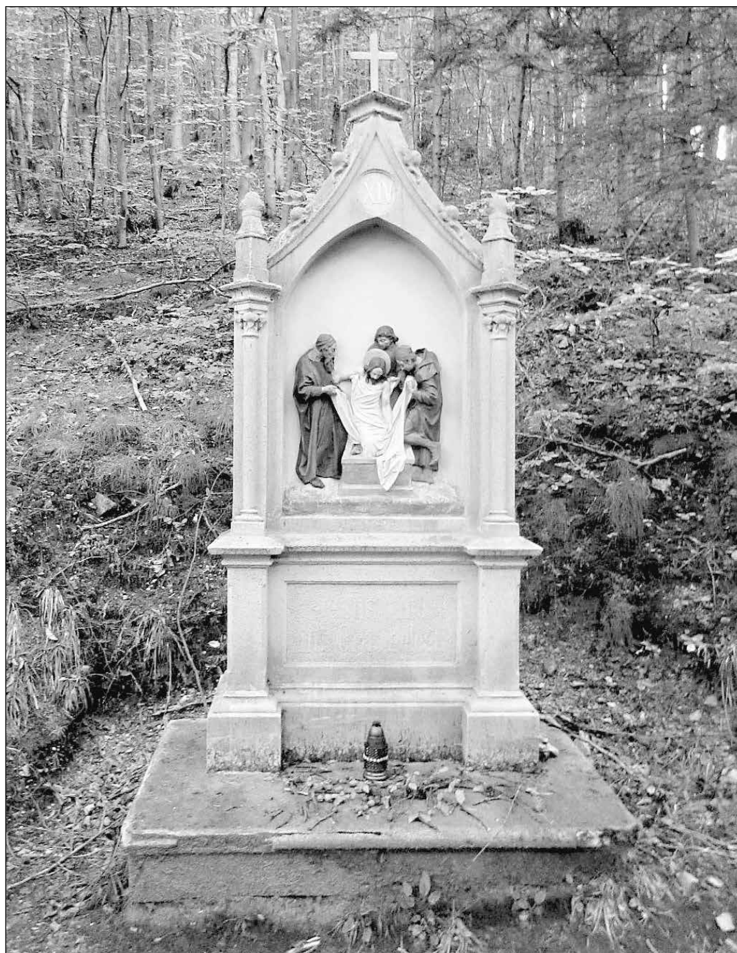
Novogotická křížová cesta v Travné

Památkově chráněná od roku 1958, zápis do státního seznamu kulturních památek 8. 10. 1973