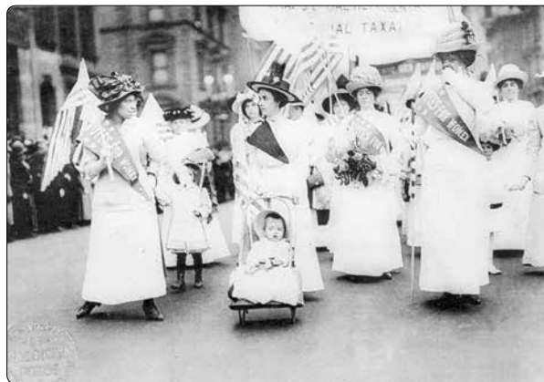
Přehlídka sufražetek v New Yorku v roce 1912

Čtvrtá lež feministek zní: „Běžně dostupná antikoncepce povede k tomu, že potrat nebude potřebný.“ Je to lež, poněvadž průzkumy ukazují, že tam, kde se všeobecně rozšířila antikoncepce, se také zvýšil počet potratů. „Zkoumání reprezentativní skupiny 2000 Španělek v plodném věku (15–49 let) bylo prováděno v letech 1997–2007. Vyplývá z nich, že ve sledovaném období počet žen používajících antikoncepci vzrostl z 49,1 % na 79,9 %. Ve stejné době vzrostl počet potratů v této oblasti z 5,52 aborcí na 1000 žen na číslo 11,49. Další zkoumání potvrzující zvyšující se čísla pocházejí z Fran-