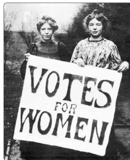
Sufražetky Annie Kenneyová a Christabel Pankhurstová, r. 1908