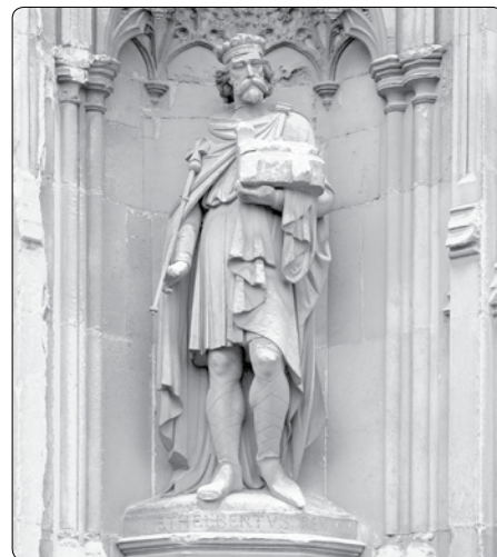
Socha svatého Etelberta, Canterburská katedrála

Východní pobřeží vzkvétající římské provincie Británie na počátku 5. století obsadily pirátské hordy germánských, skotských a irských nájezdníků. Odřízly tak ostrov od zbytku impéria, přerušily spojení s civilizovaným světem, a tím Británii odřízly i od životodárné mízy proudící z Apoštolského stolce. Neslo to s sebou i nejzávažnější důsledek – úpadek křesťanství. Téměř dvě staletí se Británie utápěla v obnoveném pohanství, než do ní zavítal v čele čtyřicetičlenné skupiny misionářů sv. Augustin z Canterbury. Působil v království Kent, jehož panovník Augustinův apoštolát všemožně podporoval a který tak má na znovupřijetí víry v Británii, rozdělené na několik menších království, rovněž lví podíl – sv. Etelbert.