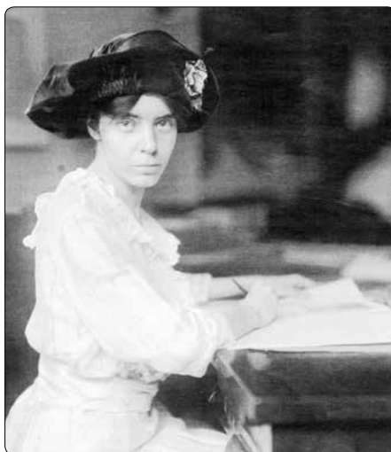
Alice Paulová, jedna z prvních sufražetek, odpůrkyně potratu, r. 1915

Jedna z prvních sufražetek a průkopnic hnutí ve věci zrovnoprávnění žen – Alice Paulová – chápala velmi dobře záležitost, že potrat neřeší problém těhotné ženy, ale pohodlného muže, který se tímto způsobem zbavuje tíže zodpovědnosti za své dítě. Takové stanovisko bylo všeobecné mezi prvními feministkami. Potraty nazývala Paulová prostě „využíváním žen“ nebo také „zabíjením nenarozených žen“ (protože přece část z potracených dětí jsou děvčátka). Zajímavé je, že svoje názory vůbec nevyvozovala z víry, ale z čistého feminismu... „Paulová na sto procent věděla, že plod rozvíjející se v matčině bříchu je plnohodnotný člověk. Někdy muž, jindy žena – a přerušování těhoten-