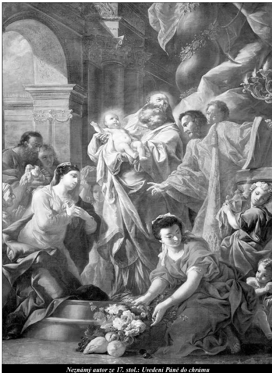
Neznámý autor ze 17. stol.: Uvedení Páně do chrámu

Patronové hodin Čestné strážě - strana 12 -