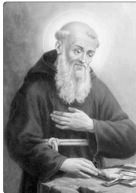
Svatý Josef z Leonessy

Otec Josef se ve svém poslání osvědčil natolik, že jej představení o šest let později (roku 1587) vyslali do Cařihradu, aby zde, v metropoli Osmanské říše, poskytoval duchovní péči křesťanským zajatcům a otrokům, kterých zde bylo obrovské množství. Procházel ulicemi města a pomáhal, kde a jak se dalo – slovem, manuálně, materiálně. Život v nebyvalé chudobě, který otec Josef s ostatními misionáři v opuštěném benediktinském klášteře vedl, v chudobě, v níž ještě dovedl rozdávat, neunikl pozornosti Turků. Zvláště když se zbožný kapucín opakovaně nabízel za otroka namísto někoho jiného. Pokaždé byl odmítnut. Jednou navečer zabloudil a znenadání se ocitl v samé blízkosti vojenských objektů. Vzbudil pozornost posádky, kterou nenapadlo nic jiného, než že zde tento mnich provádí vyzvědačskou činnost. Měsíc strávil ve vězeňské kobce, než byl na zásah benátského velvyslance propuštěn.