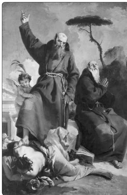
Giovanni Battista Tiepolo (1696–1770): Svatý Fidel ze Sigmariny a svatý Josef z Leonessy

Slavným se stal jeho čin ve vsi Arquata, kterou přepadli loupežníci. Když sem poté přišel, aby prosil o almužny, vesničané ho žádali, aby jim pomohl, protože nikdo jiný dosud s obávanými násilníky nic nesvedl. Otec Josef potom neohroženě procházel okolními lesy a vyhledával loupežníky. Povedlo se mu je všechny shromáždit v jednom menším kostelíku, kde k nim s křížem v ruce promlouval o Kristu. Vyzýval je, aby změnili svůj život a obrátili se. A opravdu – loupežníci si dali říct, obrátili se, zanechali dosavadního způsobu života a stali se horlivými křesťany.