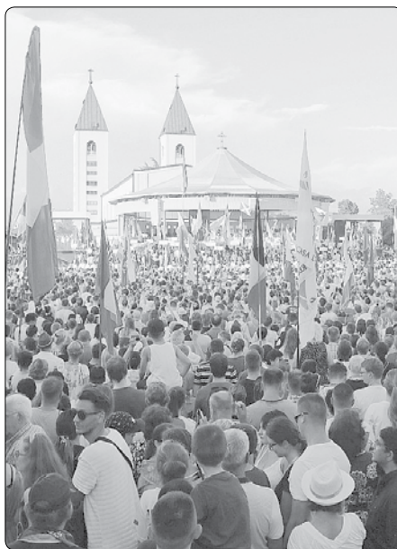
Festival mládeže v Medžugorje (1.-6. srpna 2021)

Přátelé, i každému z vás Ježíš říká: „Pojďte! Následujte mě!“ Mějte odvahu žít své mládí tak, že se svěříte Pánu a vydáte se s ním na cestu. Nechte se přemoci jeho láskyplným pohledem, který nás osvobozuje od svodů modly, od falešného bohatství, které slibuje život, ale přináší smrt. Nebojte se přijmout Kristovo slovo a přijmout jeho výzvu. Nenechte se odradit jako bohatý mladík v evangeliu, ale upřete svůj pohled na Marii, velký