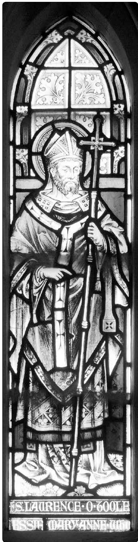
Svatý Vavřinec O'Toole, vitráž okna baptisteria katedrály v Dublinu