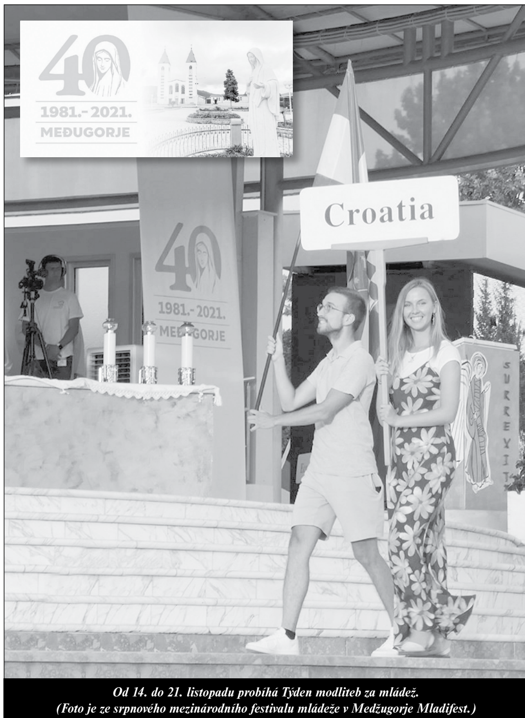
Od 14. do 21. listopadu probíhá Týden modliteb za mládež. (Foto je ze srpnového mezinárodního festivalu mládeže v Medžugorje Mladifest.)

127 mučedníků španělské občanské války - strana 12 -