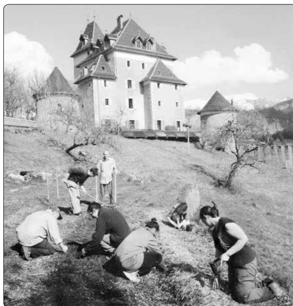
Beauregard, opevněný dům z 13. století

Rád bych ještě vyjádřil svoji velkou radost z toho, že se ze mne stal člověk adorace eucharistického Je-